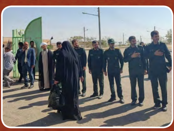
کاروان خراسان جنوبی برای دیدار یار هبر انقلاب عازم تهران شد