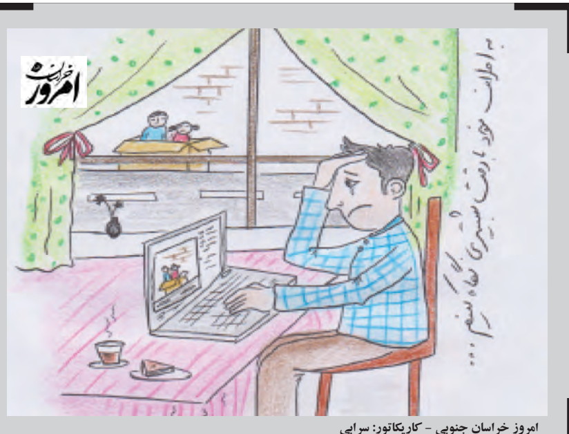
امروز خراسان جنوبی - کاریکاتور: سرای