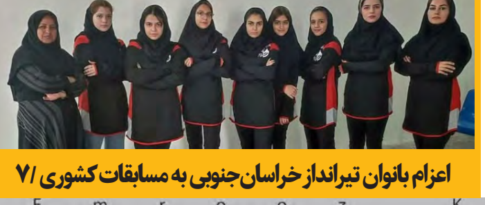
اعزام بانوان تیرانداز خراسان جنوبی به مسابقات کشوری ۷