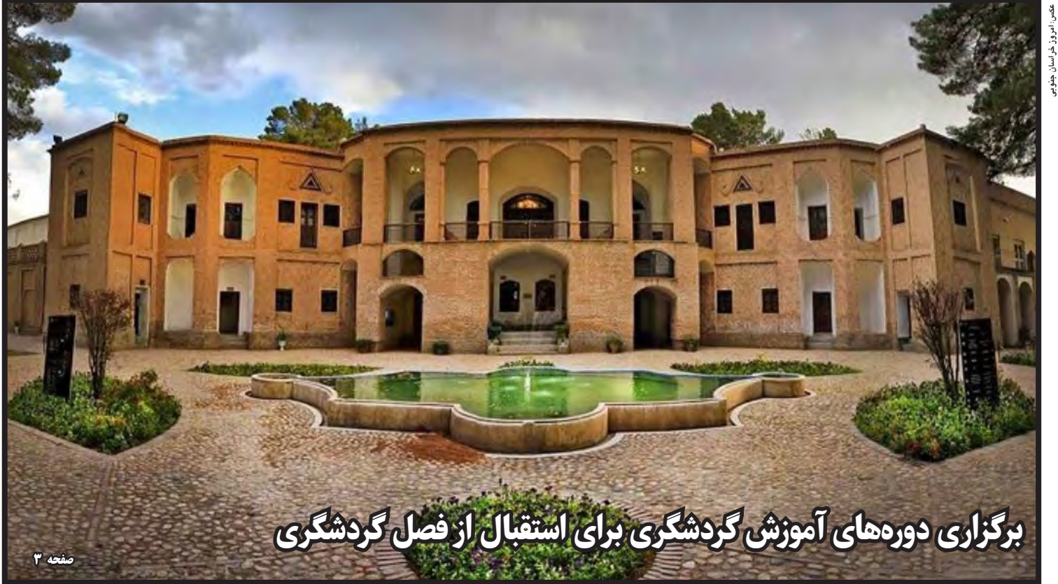
کاروان خراسان جنوبی برای دیدار با رهبر انقلاب عازم تهران شد برگزاری دوره‌های آموزش گردشگری برای استقبال از فصل گردشگری