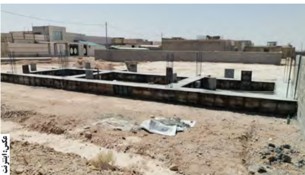
پروژه مهم زیرساختی در حوزه صنایع دستی شهرستان هر چه سریعتر به بهره برداری برسد. از مهمترین صنایع دستی شهرستان می توان به گیوه سنتی خاص طبس که در مسیر توسعه قرار گرفته، سینی های مسی که عمدتاً با طرح نخل و پلیکان و طرح های ظریف و مینیاتوری و به شیوه مخصوص طبس قلم زنی شده، حصیربافی از برگ های نخل، فرش دستباف، سیدیافی، مس گری، حوله بافی، انواع گلیم، سفال و سرامیک، تولیدات چرمی، تراش سنگ های قیمتی و نیمه قیمتی و اشاره کرد.