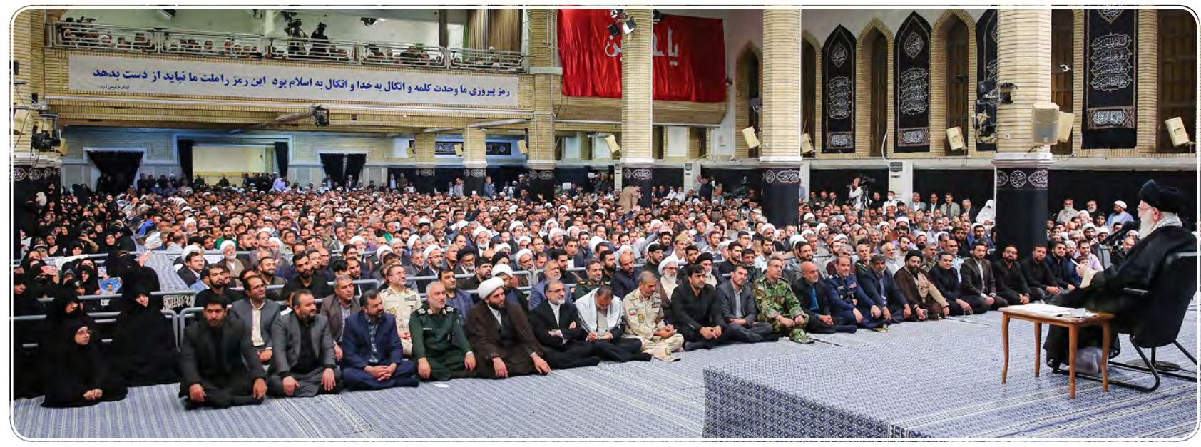
رزم پیروزی ما وحدت کلمه و اتکال به خدا و اتکال به اسلام بود این رمز رامت ما نباید از دست بدهد

نمی‌توانند کار بزرگ و مهمی انجام دهند، گفتند: دشمن در دشمنی و نقشه‌کشی خود جدی است، ما هم در مقابله با دشمن به شدت جدی هستیم. حضرت آیت‌ا... خامنه‌ای در بخش پایانی سخنانش با اشاره به حضور خوب ملت در مراسم اربعین و با تشکر صمیمانه از ملت عراق بخاطر پذیرایی و مهمان‌نوازی ارزشمند با جدیت، خدمت‌رسانی به منطقه را قوت و گسترش دهند که ایجاد خط آهن شمال به جنوب در استان و تأمین حق مردم در زمینه آب از جمله کارهای ضروری است. ایشان افزودند: البته اگر مصوبات سفر اوایل دهه ۸۰ به سیستان و بلوچستان، کامل اجرا و دچار بی‌توجهی و غفلت نمی‌شد چهره امروز استان متفاوت بود که امیدواریم این دولت نقطة‌ای است که به نظر آنها می‌تواند باعث بحران شود. رهبر انقلاب گفتند: از نظر آنها، تفاوت‌ها و اختلاف‌های قومی و مذهبی و مسئله جنسیت و زن جزو نقاط بحران‌ساز در ایران است که می‌خواهند با تحریک آنها به کشور عزیز ما ضربه وارد کنند اما شتر در خواب بیند پنبه دانه! ایشان با اشاره به تصریح برخی آمریکایی‌ها