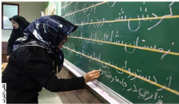
مدیرکل آموزش و پرورش خراسان جنوبی

مدیرکل آموزش و پرورش خراسان جنوبی از جذب و برخورداری از آموزش رایگان ۳ هزار و ۸۰۰ سوادآموز دوره‌های سه‌گانه سواد، تحکیم و انتقال استان، در تابستان جاری خبر داد و گفت: امسال ۳ هزار سوادآموز دوره‌های سوادآموزی از برنامه‌های مکمل سواد برخوردار شدند.