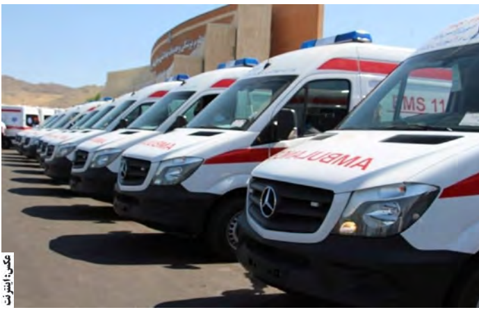
معاون فنی اورژانس

اربعین حسینی به ایلام و مرز مهران اعزام شده‌اند. معاون فنی و عملیات اورژانس پیش‌بیمارستانی خراسان جنوبی با اشاره به اینکه خدمات اورژانس تا ۱۹ شهریور به زوار ارائه شده است، تصریح کرد: ۶ آمبولانس از استان جهت خدمت‌رسانی در مرز فعال بوده‌اند. او گفت: توصیه می‌شود افراد اقدامات خودمراقبتی و خودامدادی را هم فرا بگیرند تا قبل از رسیدن نیروهای اورژانس به محل، بتوانند از شانس بیشتری برای نجات برخوردار باشند. تکنسین‌های اورژانس خراسان جنوبی در مدت ۲۲ روز در استان ایلام خدمت‌رسانی کرده‌اند.