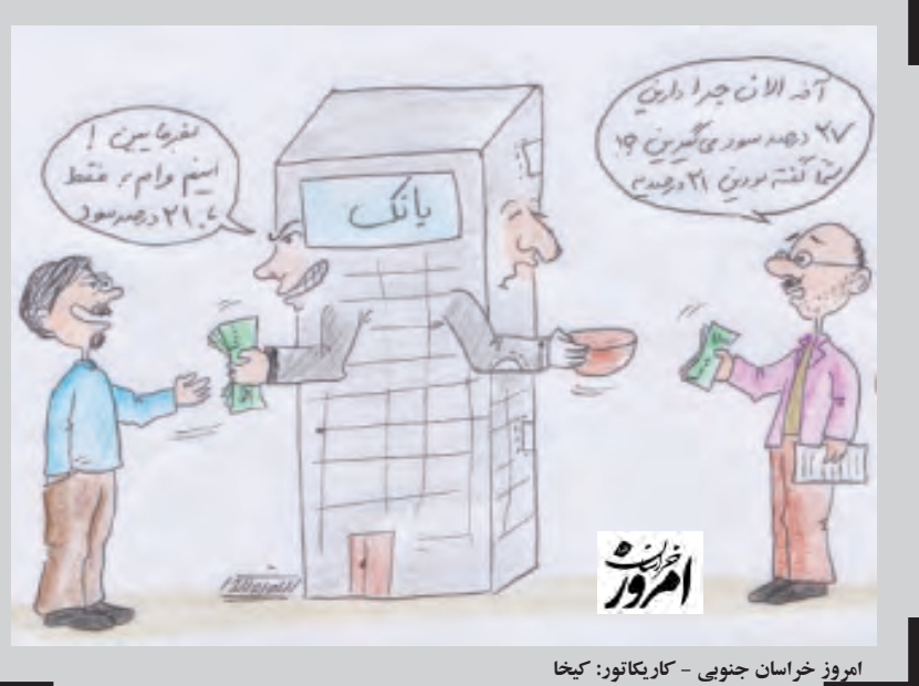
امروز خراسان جنوبی - کاریکاتور: کیخا

هماهنگی‌های لازم را انجام بدهید: سعی کنید برای حضور خود در روز بازگشایی از قبل برنامه ریزی کنید. حتماً به موقع و حتی کمی زودتر حضور پیدا کنید. و حتماً فرزندتان استراحت و تغذیه مناسبی داشته باشد. سعی کنید از عوامل تنش‌زا به دور باشید و با کمال آرامش و انرژی در کنار فرزندتان روز به یادماندنی فراهم نمائید. و در پایان برای رشد همه جانبه فرزند عزیزتان، با سیستم مدرسه همسو باشید و در جلسات تعیین شده حضور داشته باشید.