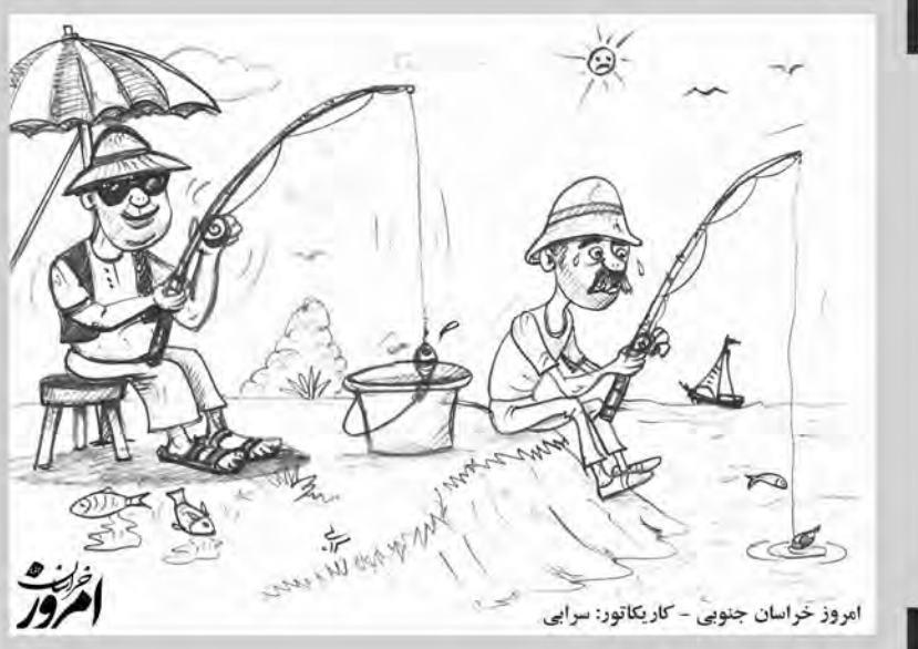
امروز خراسان جنوبی - کاریکاتور: سرایی