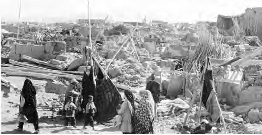
برآورد و معرفی می شود.