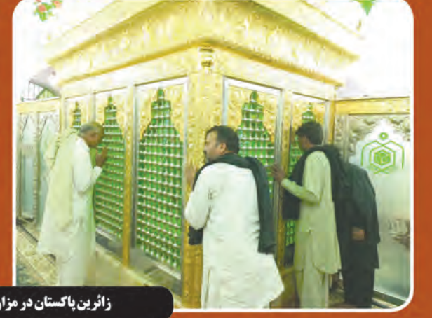
زائرین پاکستان در مزار آقا سید علی نهندان