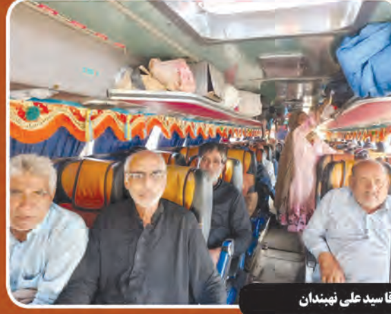
زائرین پاکستان در مزار آقا سید علی نهندان