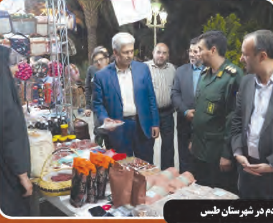
نمایشگاه اقتصاد به توان مردم در شهرستان طبس