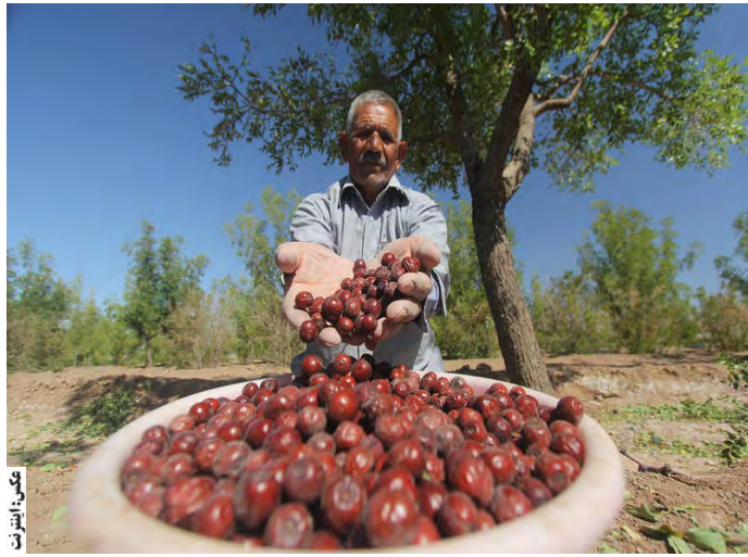
امروز خراسان جنوبی - کیخا

محصول عناب از کشاورزان توسط بورس انجام شود. وی با اشاره به اختصاص ۸۰۰ میلیارد تومان برای احیای واحدهای راکد استان، افزود: هزار و ۳۶ میلیارد تومان تسهیلات برای شرکت های تعاونی استان اختصاص یافته است که بین دستگاه های مختلف تقسیم می شود تا بیشتر در مناطق روستایی کمتر توسعه یافته، صنایع دستی و بانوان هزینه شود. همچنین در این جلسه عنوان شد که تسهیلات به ۱۱۴ واحد تولیدی فعال منطقه آزاد ویژه اقتصادی بیرجند با همکاری سازمان صمت و جهاد کشاورزی تعلق گیرد.