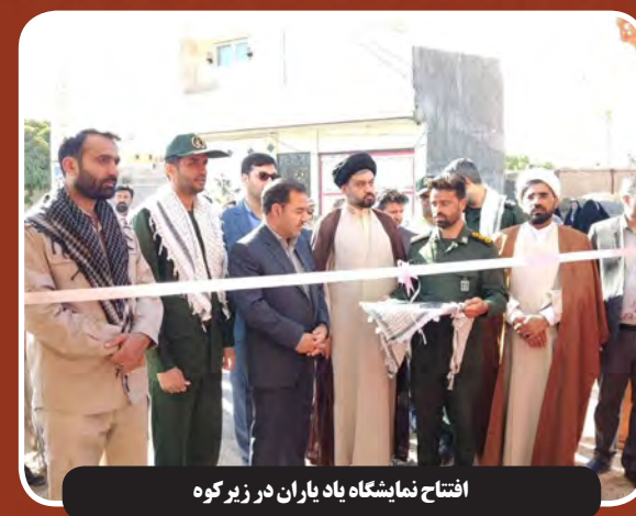
افتتاح نمایشگاه یاد یاران در زیر کوه