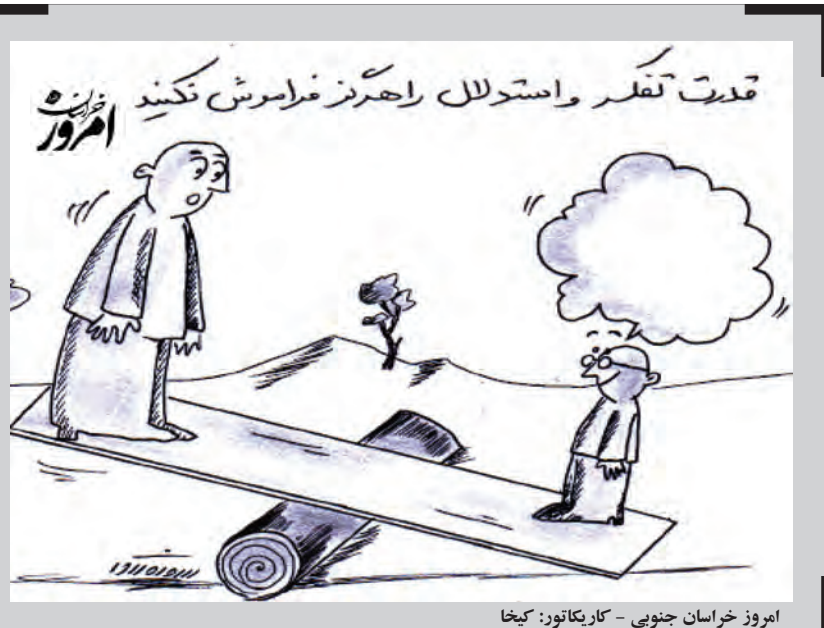
امروز خراسان جنوبی - کاریکاتور: کیخا

همایش پیاده روی خانوادگی به مناسبت گرامیداشت هفته دفاع مقدس در روستای علی آباد در میان برگزار شد. به مناسبت گرامیداشت هفته دفاع مقدس و در راستای توسعه ورزش همگانی، همایش پیاده روی خانوادگی با حضور جمعی از مردم و اهالی روستای علی آباد بخش گزیک شهرستان درمیان برگزار شد. در پایان این همایش به قید قرعه به شرکت کنندگان جوایزی اهدا شد.