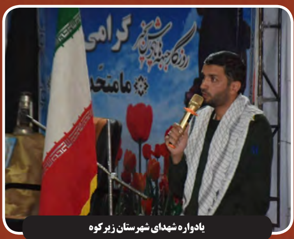
یادواره شهدای شهرستان زیر کوه