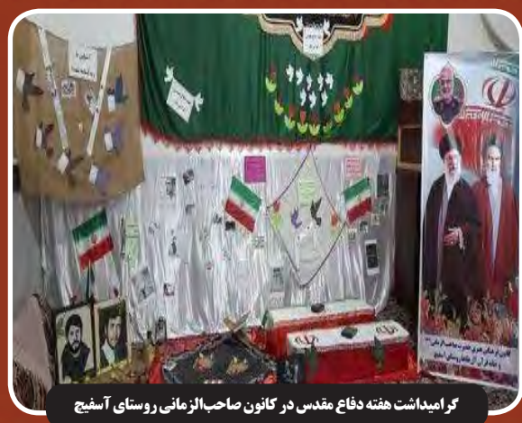
گرامیداشت هفته دفاع مقدس در کانون صاحب الزمانی روستای آسبج