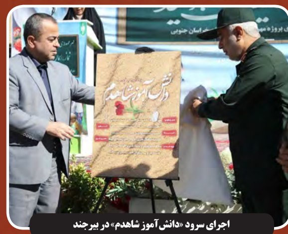
اجرای سرود «دانش آموز شاهد» در بیرجند