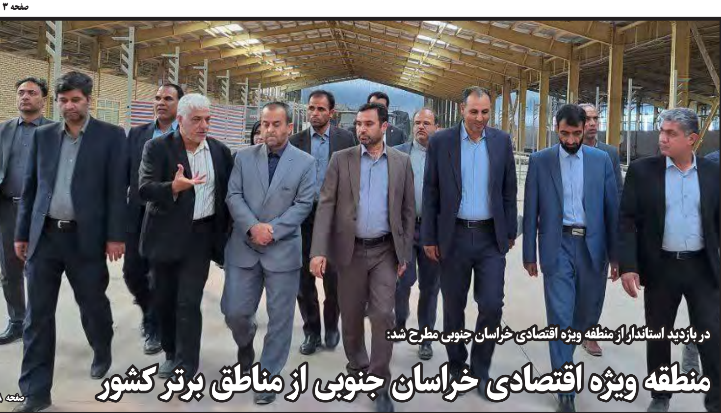
در بازدید استاندار از منطقه ویژه اقتصادی خراسان جنوبی مطرح شد: