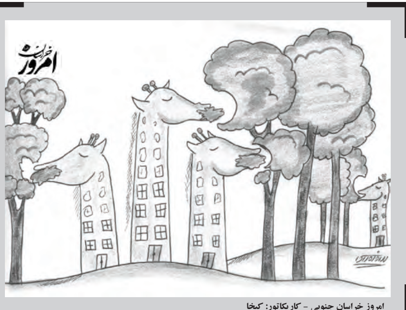
امروز خراسان جنوبی - کاریکاتور: کیخا

دوربین اشاره و گفت: شهرداری باید دوربین هوشمند کنترل سرعت را در سطح شهر نصب کند و اعتبار آن باید از محل ماده ۲۳ جرائم راهنمایی و رانندگی که بعد از واریز به خزانه به استان ها برگشت داده می شود، تأمین شود که این اعتبار در سنوات گذشته تزییق نشده و از بدهی ۲۰ میلیارد تومانی در این محل فقط ۲ میلیارد تومان پرداخت شده است.