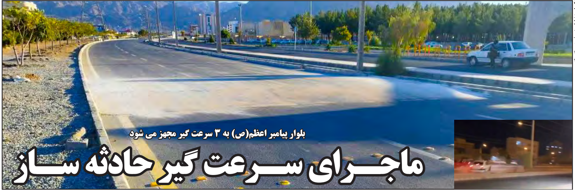
بلوار پیامبر اعظم (ص) به ۳ سرعت گیر مجهز می شود