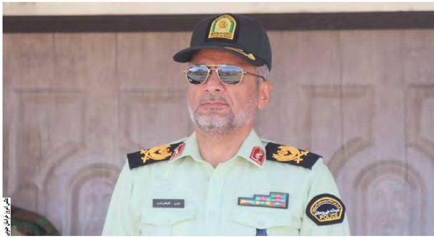
محور کویری "طیس به یزد" منطقه کویری حلوان شناسایی کردند.

وی افزود: تیم های عملیاتی پلیس مبارزه با مواد مخدر استان خراسان جنوبی با اجرای طرح های عملیاتی اطلاعاتی و شناسایی دقیق مسیر تردد