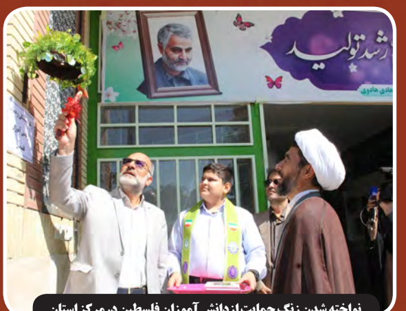
نواخته شدن رنگ حمایت از دانش آموزان فلسطین در مرگز استان