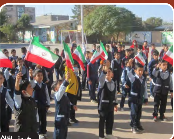
خوش انقلابی دانش آموزان جنوبی در اعلام همبستگی و حمایت از دانش آموزان مظلوم فلسطین