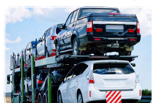
تعداد خودروهای وارداتی در شرایطی است که یکی از مهم ترین دلایل قانون واردات خودرو، تعدیل کفه عرضه و تقاضا در بازار خودرو بود؛ بازاری که به دلیل عدم پاسخگویی به تقاضا (عدم عرضه کافی)، با افزایش قابل توجه قیمت خودروها در یکی دو سال اخیر مواجه بوده است، حال باید این سوال را مسئولان وزارت صمت پاسخ دهند که با ۳۰ هزار خودروی وارداتی در برای تقاضای خودرو، چه تاثیری قرار است بر قیمت ها داشته باشد؟ چرا وزارت صمت چندین ماه مردم را چشم انتظار واردات ۲۰۰ هزار خودرو گذاشت و حالا بدون توجه به فضای انتظاری که به وجود آمده بود، می گوید هنوز مشخص نیست که ادامه فروش خودروهای وارداتی چگونه است؟! همه این ابهامات و سوالات در شرایطی است که حدود پنج ماه تا پایان سال زمان باقی مانده است و در کنار این روند لاک پشتی عمل به وعده واردات خودروهای صفر کیلومتر، قرار بوده هیات وزیران آیین نامه واردات خودروهای کارکرده را هم تعیین تکلیف کند! آیین نامه ای که با این روند و تجربه اخیر واردات خودروهای صفر کیلومتر، چشم انداز امیدوار کننده ای ندارد و باید همچنان منتظر ماند!