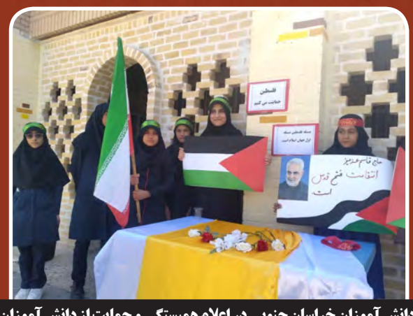
نواخته شدن رنگ حمایت از دانش آموزان فلسطین در مرگز استان