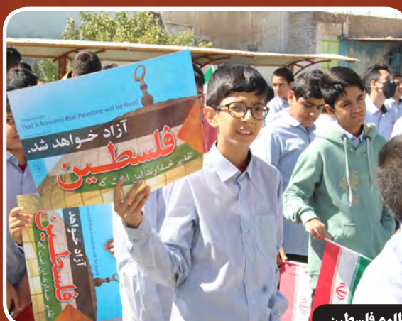
خوش انقلابی دانش آموزان جنوبی در اعلام همبستگی و حمایت از دانش آموزان مظلوم فلسطین