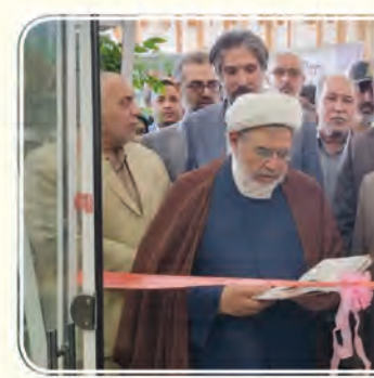
صنایع دستی شهرستان در این نمایشگاه حضور داشتند.

رئیس میراث فرهنگی شهرستان قاین هم در حاشیه برپایی نمایشگاه محصولات کشاورزی صنایع دستی از برپایی ۴۵ غرفه صنایع تبدیلی، تکمیلی، غذایی بخش کشاورزی حوزه زرشک و زعفران در نمایشگاه جانبی این مراسم مشغول بکارند. وی ادامه داد: ۸۵ درصد زرشک تولیدی قاین در پارک‌های خشک می‌شود و تعداد پارک‌های فعال شهرستان هم ۳۲۰۰ پارک است.