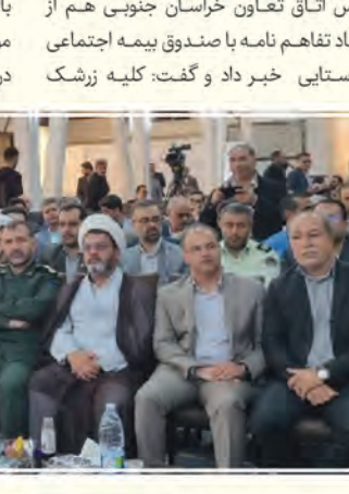
صدا و سیما در مراسم اختتامیه و افتتاح توسعه و ترویج زرشک در قاین از جمله این اقدامات بوده است. وی از ثبت نظام میراث جهانی این به عنوان اولین زرشک تولیدی دنیا و ایران، ایجاد کلکسیون زرشک و کسب اعتبار از مرکز، مبارزه دولتی با زنگ جارویی زرشک در ۱۳۱۵ هکتار از باغات زرشک استان برای اولین بار، واگذاری دو مجتمع پارک‌های زرشک به مردم، پیگیری طرح زنجیره ارزش افزوده زرشک و جذب ۴ میلیارد تومان اعتبار خبر داد.