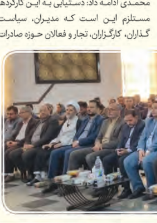
صدا و سیما در مراسم اختتامیه و افتتاح توسعه و ترویج زرشک در قاین از جمله این اقدامات بوده است. وی از ثبت نظام میراث جهانی این به عنوان اولین زرشک تولیدی دنیا و ایران، ایجاد کلکسیون زرشک و کسب اعتبار از مرکز، مبارزه دولتی با زنگ جارویی زرشک در ۱۳۱۵ هکتار از باغات زرشک استان برای اولین بار، واگذاری دو مجتمع پارک‌های زرشک به مردم، پیگیری طرح زنجیره ارزش افزوده زرشک و جذب ۴ میلیارد تومان اعتبار خبر داد.