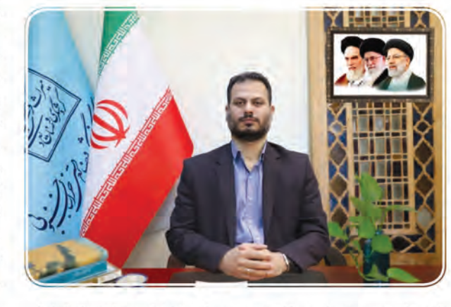
صدا و سیما در مراسم اختتامیه و افتتاح توسعه و ترویج زرشک در قاین از جمله این اقدامات بوده است. وی از ثبت نظام میراث جهانی این به عنوان اولین زرشک تولیدی دنیا و ایران، ایجاد کلکسیون زرشک و کسب اعتبار از مرکز، مبارزه دولتی با زنگ جارویی زرشک در ۱۳۱۵ هکتار از باغات زرشک استان برای اولین بار، واگذاری دو مجتمع پارک‌های زرشک به مردم، پیگیری طرح زنجیره ارزش افزوده زرشک و جذب ۴ میلیارد تومان اعتبار خبر داد.

می‌سپارند. مدیرکل میراث فرهنگی، گردشگری و صنایع دستی خراسان جنوبی افزود: سپس صافی یا چادر را گرفته و یکی از مردم که در درخت‌نوردی و در عناب تکانی ماهرتر است به بالای درخت می‌رود. عناب تکان نهایت سعی را می‌کند تا به درختان آسیبی نرسد گویی که در نظرشان درختان نیز مانند انسان‌ها جان دارند. طول چوب‌های عناب تکانی از ۱ تا ۴ متر می‌رسد و به بلندترین چوب‌ها پارو یا گلکی گفته می‌شود. در تمام مراحل جمع‌آوری