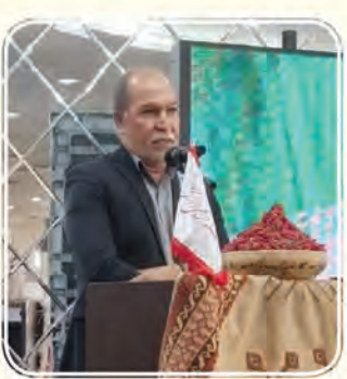
فرماندار قاین هم در این مراسم به ۳ کارکرد مهم جشنواره زرشک اشاره و گفت: ارتقای کیفی و کمی تولید محصول زرشک، نمایش توانمندی‌ها و ظرفیت‌های متعدد در ایجاد اقتصادی، جغرافیایی، فرهنگی و جغرافیایی، ظرفیت‌سازی برای تولید، فرآوری و صادرات و ایجاد اشتغال از مهم‌ترین این کارکردها محمداً ادامه داد: دستیابی به این کارکردها مستلزم این است که مدیران، سیاست‌گذاران، کارگزاران، تجار و فعالان حوزه صادرات