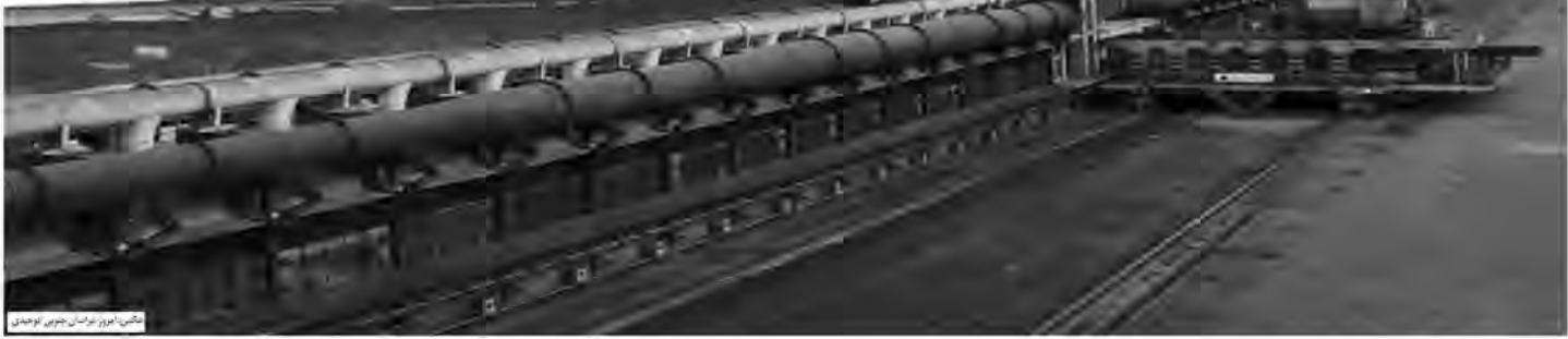
مشکل امروز برآورد جنوبی

به گفته وی هم اکنون به دنبال راه اندازی و تأمین زیرساخت‌های نیروگاه در کارخانه هستند تا این حرارتی که از باتری‌ها خارج می‌شود هدر نرود که در نیروگاه می‌توانند برق تولید کنند. وی می‌گوید: هیچ‌گونه انرژی فسیلی به غیر از زغال سنگ حتی برای پیش گرم در کارخانه استفاده نمی‌شود و از بیرون هم هیچ‌گونه انرژی برای زغال استفاده نمی‌شود.