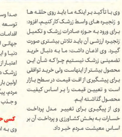
صدا و سیما در مراسم اختتامیه و افتتاح توسعه و ترویج زرشک در قاین از جمله این اقدامات بوده است. وی از ثبت نظام میراث جهانی این به عنوان اولین زرشک تولیدی دنیا و ایران، ایجاد کلکسیون زرشک و کسب اعتبار از مرکز، مبارزه دولتی با زنگ جارویی زرشک در ۱۳۱۵ هکتار از باغات زرشک استان برای اولین بار، واگذاری دو مجتمع پارک‌های زرشک به مردم، پیگیری طرح زنجیره ارزش افزوده زرشک و جذب ۴ میلیارد تومان اعتبار خبر داد.

وی به افتتاح واحدهای فناورانه در روستاها