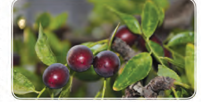
صدا و سیما در مراسم اختتامیه و افتتاح توسعه و ترویج زرشک در قاین از جمله این اقدامات بوده است. وی از ثبت نظام میراث جهانی این به عنوان اولین زرشک تولیدی دنیا و ایران، ایجاد کلکسیون زرشک و کسب اعتبار از مرکز، مبارزه دولتی با زنگ جارویی زرشک در ۱۳۱۵ هکتار از باغات زرشک استان برای اولین بار، واگذاری دو مجتمع پارک‌های زرشک به مردم، پیگیری طرح زنجیره ارزش افزوده زرشک و جذب ۴ میلیارد تومان اعتبار خبر داد.

خانه‌ها درخت عناب می‌کارند و سالانه محصول خوبی می‌دهد. در همین راستا مراسم عناب‌ته‌کنی با هدف شناساندن بیشتر این محصول در سطح ملی و بین‌المللی و همچنین جذب گردشگر در ایام برگزاری مراسم، در فهرست رویدادهای گردشگری کشور به ثبت رسید. او بیان کرد: جمع‌آوری عناب از آیین و مراسم خاص برخوردار است که امروزه دیگر کم‌رنگ شده است. در این راستا در گذشته یک روز