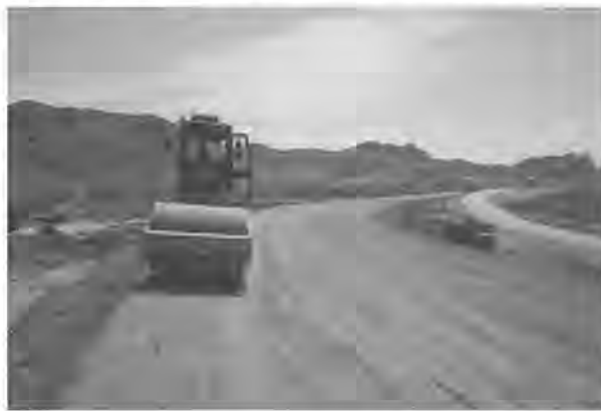
پیمانکار طلبکار و تعطیلی پروژه محور مرزی

امروز خراسان جنوبی - حمیدی بر اساس شواهد درج اخباری در فضای مجازی استان بخشی از پروژه دوبانده سازی محور سربیشه ماهی رود که توسط شرکت عمران آستان قدس در دست اجرا بوده، تعطیل و پیمانکار نسبت به جمع آوری ماشین آلات اقدام کرده است.