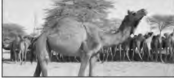
شتر در استان علاوه بر اینکه نیاز داخل را تأمین می کند به خارج از استان

امروز خراسان جنوبی- صالحی شترداران سنتی و صنعتی استان در ۷ ماه به حدود ۳۰۰ میلیارد تومان درآمد از تولید این گوشت دست یافتند.