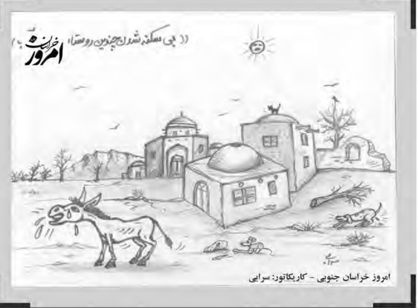
امروز خراسان جنوبی - کاریکاتور: سرایی