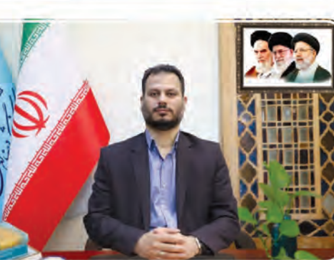
مدیرکل میراث فرهنگی، گردشگری و صنایع‌دستی استان

استان خراسان جنوبی گفت: پس از ثبت این رویداد تلاش بر این خواهد بود که در زمان برداشت خرما و فصل خرماچینی در شهرستان طیس، برای توره‌های ورودی مختص این جشنواره برنامه‌ریزی لازم انجام شود تا در شاخه‌های گردشگری کشاورزی و گردشگری خوراکی دیگر از جاذبه‌های استان به علاقه‌مندان معرفی و شناسانده شود.