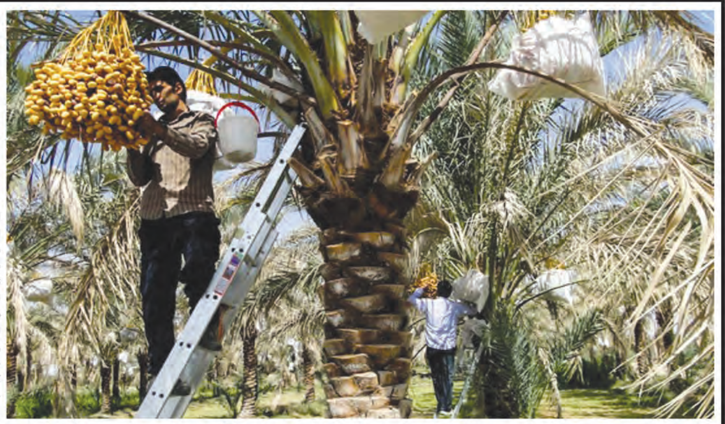
عکس امروز خراسان جنوبی - سعید

درباره ثبت جشنواره برداشت خرمای طبس در صفحه ۸ بخوانید