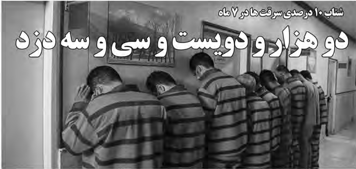
امروز خراسان جنوبی- گروه خبر