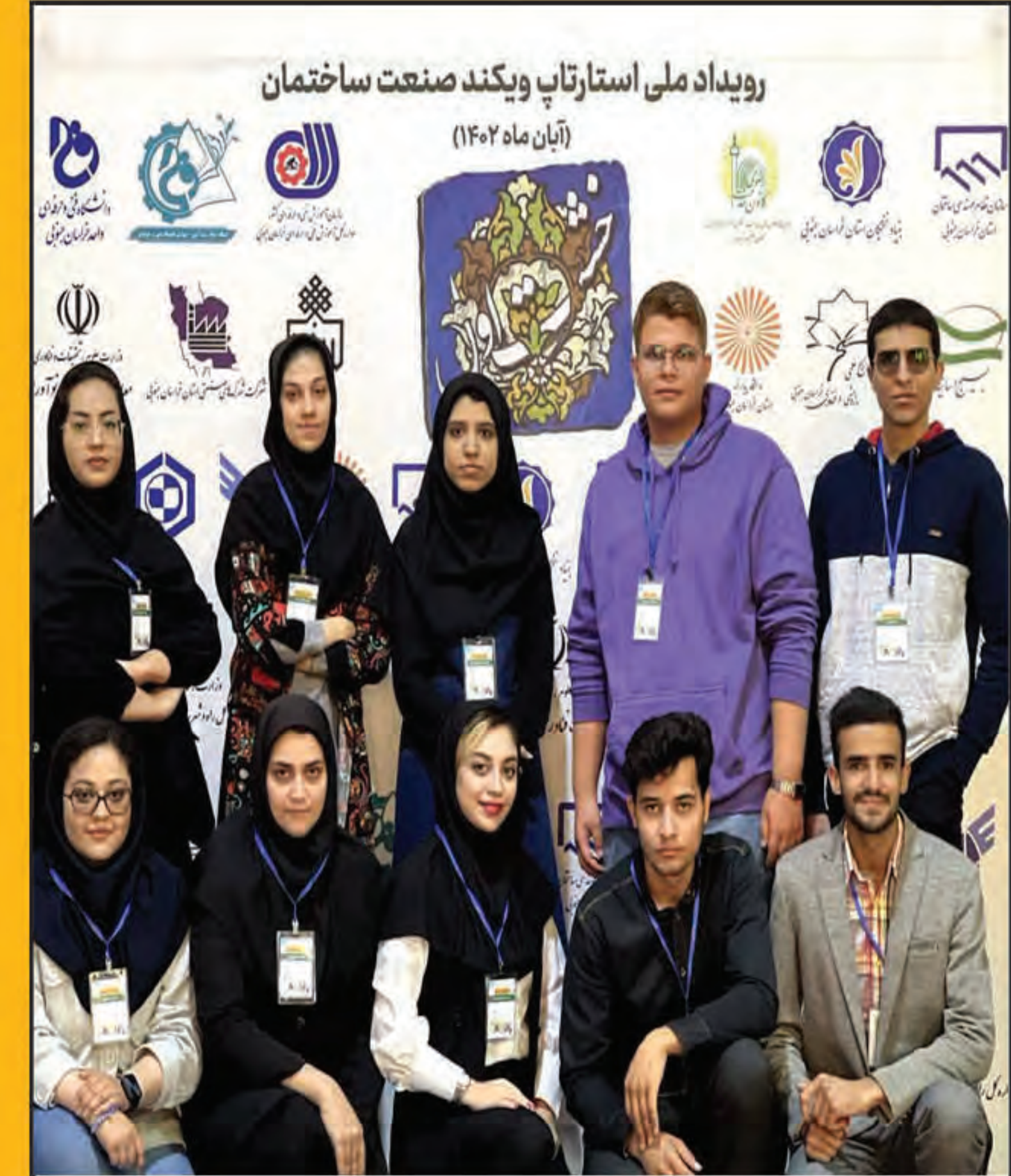
افتخار آفرینی دانشجویان فنی و مهندسی دانشگاه پیام نور بیرجند