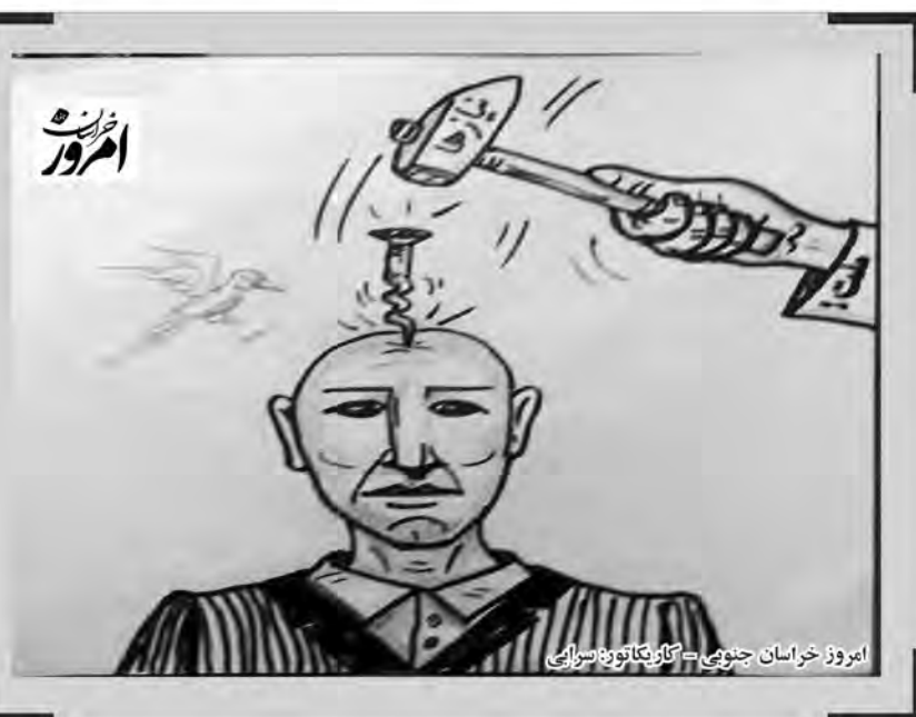
امروز خراسان جنوبی - کارتون های صهیونیستی