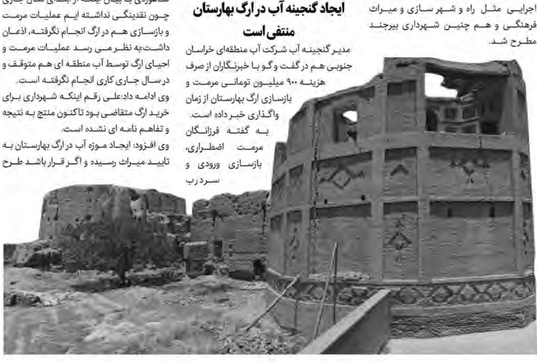
مدیر گنجینه آب شرکت آب منطقه‌ای خراسان جنوبی هم در گفت و گو با خبرنگاران از صرف هزینه ۹۰۰ میلیون تومانی مرمت و بازسازی ارگ بهارستان از زمان واگذاری خبر داده است. به گفته فرزانگان مرمت اضطراری، بازسازی ورودی و سردرب

واگذاری ارگ در سال ۹۹ به آب منطقه‌ای در نهایت بعد از پیگیری های چند ساله ارگ بهارستان در سال ۹۹ به آب منطقه ای واگذار و قرار شد موزه آب در آنجا مستقر و ارگ بار دیگر احیا و به روزهای شکوهش بازگردد. مدیرعامل وقت شرکت آب منطقه ای خراسان جنوبی در همان سال از راه اندازی گنجینه آب در ارگ خبر داد و به رسانه ها گفت: طبق تفاهم انجام شده با میراث فرهنگی بعد از تحویل ارگ به شرکت آب منطقه ای، با همکاری میراث فرهنگی عملیات مرمت و بازسازی آن ادامه پیدا می کند تا زمینه برای استقرار گنجینه آب فراهم شود.