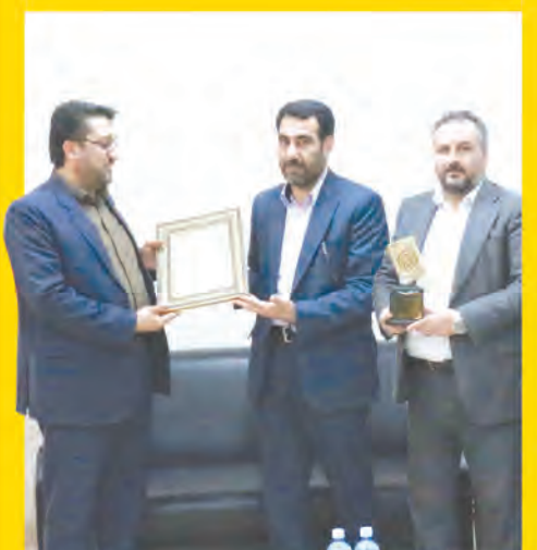
کسب رتبه برتر اداره کل امور مالیاتی استان در جشنواره شهید رجایی صفحه ۸