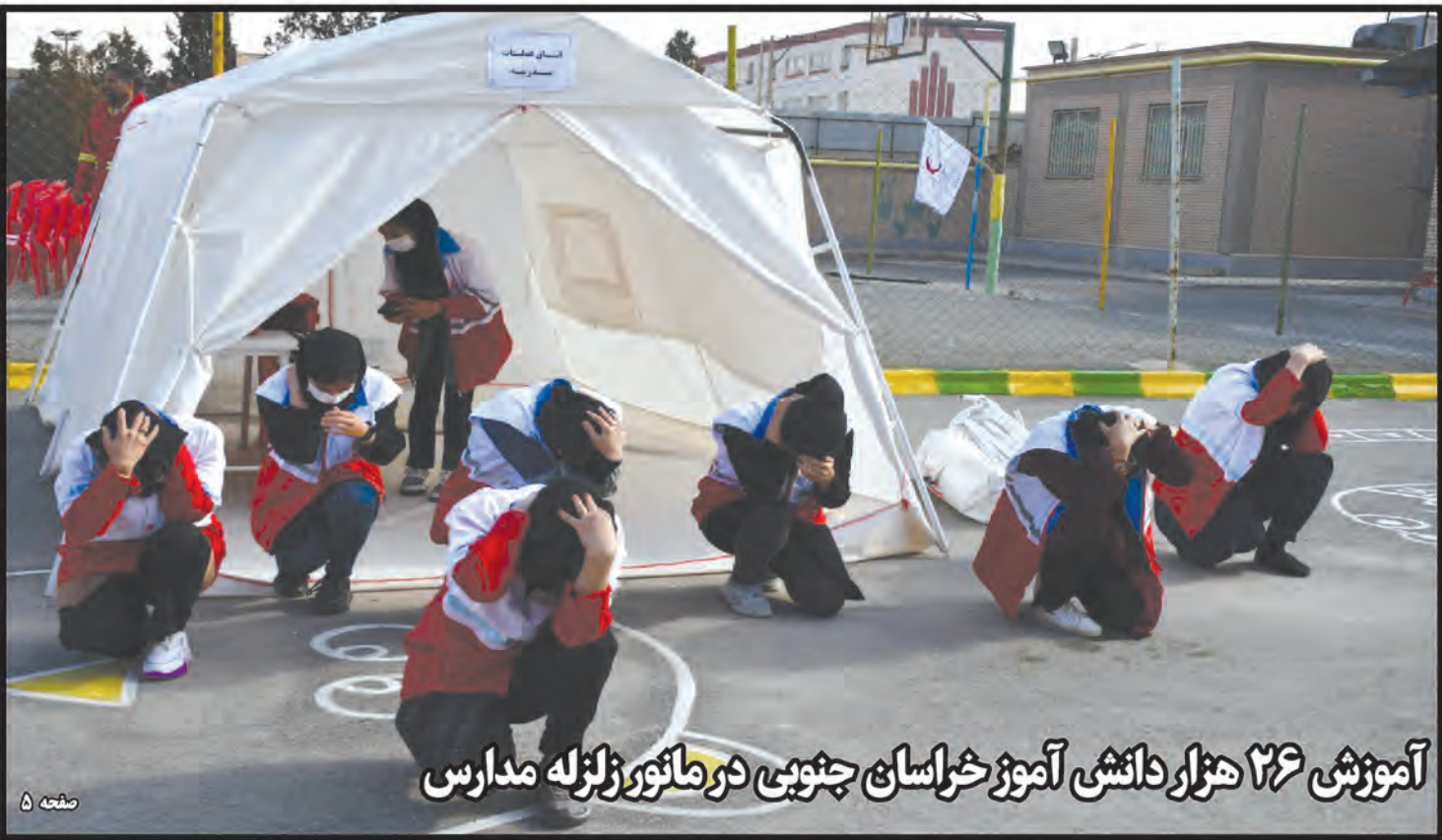
آموزش ۲۶ هزار دانش آموز خراسان جنوبی در مانور زلزله مدارس