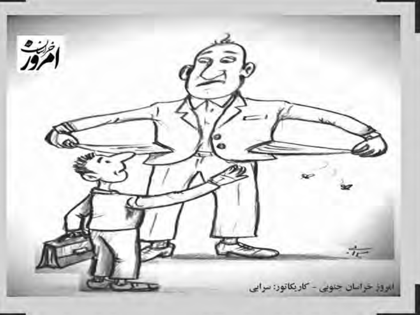
ایرئوز خراسان جنوبی - کاریکاتور: سرایی

احداث چمن مصنوعی دراصغریه و معدن قلعه زری امروز خراسان جنوبی - دانش ساخت زمین چمن مصنوعی در مراکز بخش ها و روستاها خدمت بزرگی در راستای کمک به مردم و به ویژه جوانان و نوجوانان مستقر در این بخش‌ها است. احداث زمین چمن مصنوعی در نقاط مختلف روستایی با هدف توزیع عادلانه امکانات ورزشی، نشان دهنده عزم دولت در راستای توسعه فضای ورزشی در تمام مناطق کشور است. فرماندار شهرستان خوسف با بیان نقش توجه به توسعه اماکن و امکانات ورزشی در شهرها، بخش‌ها و روستاها در کاهش آسیب‌های اجتماعی اظهار کرد: تکمیل و احداث چمن مصنوعی در شهر خوسف، روستاهای گل، بصیران، نصرآباد و بین آباد از جمله اقداماتی است که منجر به افزایش سرانه ورزشی و ایجاد روحیه شور و نشاط در بین مردم و بویژه جوانان و نوجوانان شده است. سید علی حسینی یکی دیگر از مصوبات سفر استاندار خراسان جنوبی به بخش جلگه ماژان را تخصیص مبلغ ۲۰ میلیارد ریال از محل اعتبارات استانی به اداره کل ورزش و جوانان برای احداث زمین چمن مصنوعی روستاهای اصغریه و قلعه زری برشمرد و افزود: با عملیاتی شدن این طرح، شاهد توسعه زیرساخت های ورزشی در بخش جلگه ماژان خواهیم بود.