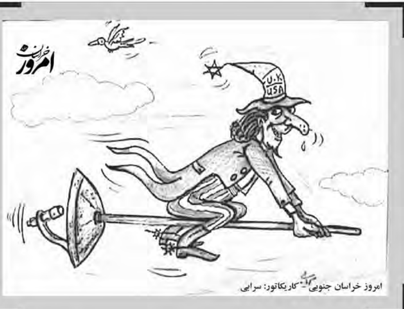
امروز خراسان جنوبی