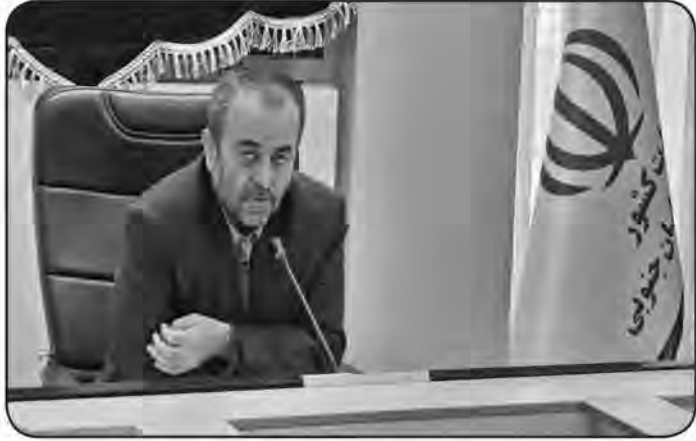
امروز خراسان جنوبی- گروه خبر

پرچم مطالبه گری باید در دست دانشجویان انقلابی و بسیجی باشد