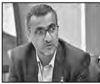
تذکر جدی به واحد داده شد و پس از آن آتش سوزی رخ داد.

عباس زاده افزود: این حادثه مربوط به بخش خصوصی بود، اما دولت به مدیریت آن ورود کرد که این موضوع پیامی روشن برای سرمایه گذاران علاقه مند به سرمایه گذاری در استان دارد و آن پیام این است که دولت از سرمایه گذاران در هر حالتی حمایت می کند. جانشین ستاد مدیریت بحران استان، تقویت زیرساخت ها برای مقابله با بحران ها را با اهمیت دانست و گفت: طبق دستور وزیر کشور برای تقویت آتش نشانی های سطح استان اقدام می شود؛ از جمله دلایل سفر وزیر کشور به استان نیز این بود که ظرفیت ها در کنار هم قرار گیرند و برای اطفای حریق امور لازم صورت گیرد.