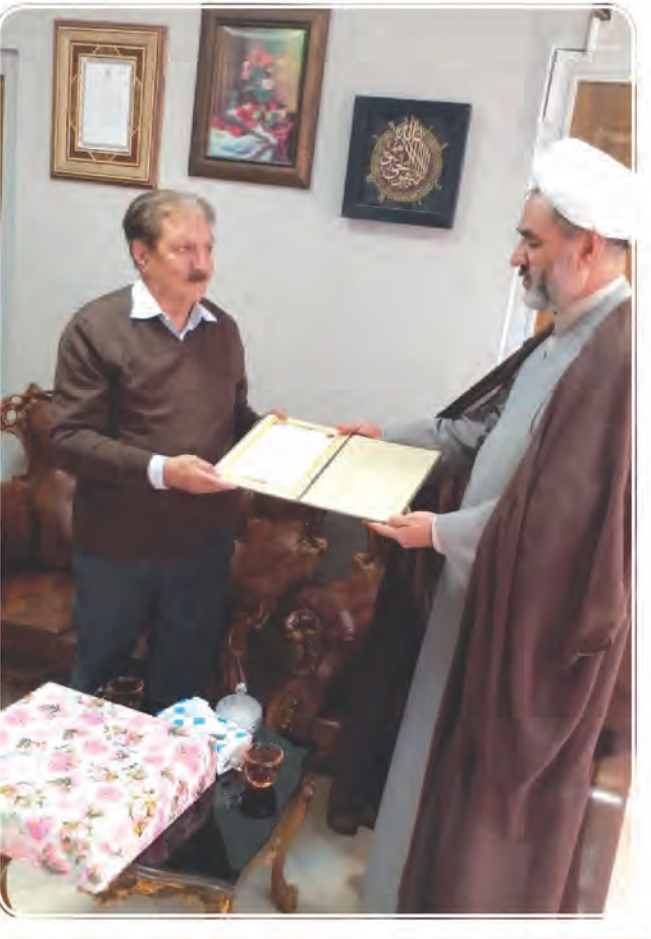
مدیرکل اوقاف و امور خیریه استان خراسان جنوبی در دیدار با مدیرکل اوقاف و امور خیریه شهرستان بیرجند.