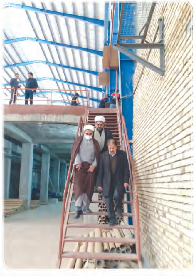
مدیرکل اوقاف و امور خیریه استان خراسان جنوبی در بازدید از واحد تولیدی کاشی و سرامیک فرزاد.

استاندارداری خراسان جنوبی و اداره کل اوقاف و امور خیریه استان از کمک مالی مدیر عالی کاشی و سرامیک فرزاد در کمک به زائران پاکستانی در ایام پاپانی صفر قدردانی شد. هم چنین مدیر کل اوقاف استان خراسان جنوبی و مدیر اوقاف شهرستان بیرجند در ادامه از کارخانه کاشی و سرامیک و تولید کاغذ این واحد بزرگ صنعتی بازدید کردند.