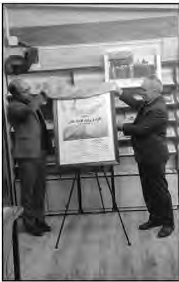
مقام برتر جشنواره علمی چمران به استان رسید