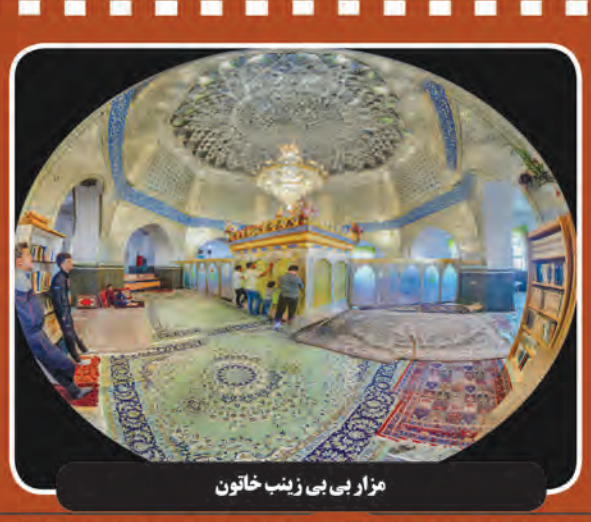
مزار بی بی زینب خاتون