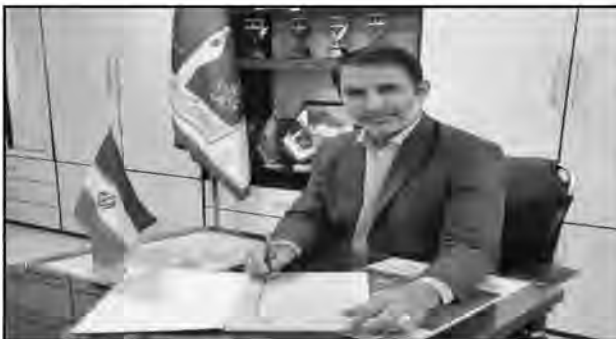
سهامیه امسال ۳ هزار و ۸۰۰ سواد آموز استان در کلاس های دوره سواد آموزی، هزار و ۱۰۰ نفر در دوره تحکیم و هزار و ۲۰۰ نفر در دوره انتقال جذب می شوند.

به گفته وی از آنجایی که یکی از عوامل بروز جرم در جامعه بی سوادی و ناآگاهی افراد کم سواد است، طرح جذب سواد آموزان در ندامتگاه های استان اجرایی شد که با استقبال کم سوادان ندامتگاه ها روبه رو شده و حتی با اشاره به کسب رتبه برتر کشور در ارزیابی شاخص های ۲۲ گانه سواد آموزی، گفت: هم اکنون طرح هایی از جمله طرح خودآموز، طرح توسعه سواد زنان روستایی و طرح مرکز یادگیری محلی مشارکتی، در حوزه سواد آموزی آموزش و پرورش اجرا می شود.