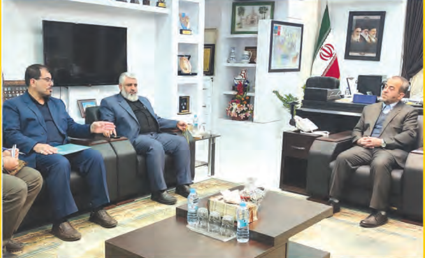
تأثیر نگاه انقلابی در ترویج و توسعه فرهنگ ایثار و شهادت