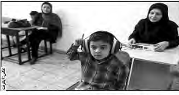
گرفته اند. رئیس آموزش و پرورش استثنایی خراسان جنوبی گفت: ۶ هزار و ۴۰۰ نوآموز هم نوبت گیری کرده و ۱۳۹۶ تا اول مهر ۱۳۹۷ هستند.