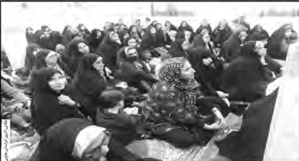
فرزندان حتی از پدر و مادر خود نیز دستوری اموری که بچه توان انجام آن دارد به او محول نکنند ظلم در حق آن فرزند است. احترامی با تأکید بر اینکه والدین نباید فرزندان شان را با همدیگر مقایسه کنند، ادامه داد: همچنین رعایت عدالت در میان فرزندان بسیار حائز اهمیت است چرا که در صورت عدم رعایت عدالت میان فرزندان، در زمان بزرگسالی وقتی از چهارراه های پرخطر نوجوانی گذر می کنند این

قوانین مذهبی، ارتباط با دیگران، حل مسئله و صمیمیت و همدلی را فراموش کردن در دوران دبیرستان نمی توان آنها را اصلاح و تربیت کرد. وی ۷ سال سوم رشد فرزندان را دوران وزارت دانست و گفت: در این مرحله از زندگی باید به فرزند خود به عنوان یک مشاور و وزیر نگاه کنید و در کارها از او مشورت بگیرید تا عزت نفس و شخصیت او را تقویت کنید و اگر نقاط اشتباه داشتند نیز اشکالات آنها را با زبان منطقی به آنها گوشزد کنید. وی بر ارتقای حس عزتخواهی و همدلی در این سنین تأکید و تصریح کرد: فرد ستیزه جو، لجباز و پرخاشگر در میان گروه همسالان خود جایی ندارد و اینگونه افراد پس از مدتی به دلیل رانده شدن از گروه های هم سن خود، منزوی و گوشه گیر خواهند شد. وی ادامه داد: باید اهمیت رعایت قوانین و مقررات مدرسه را به دانش آموزان بگویند تا محبوب بچه های دیگر باشند.