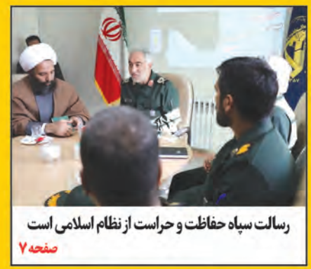
رسالت سپاه حفاظت و حراست از نظام اسلامی است

رونمایی از «ره نامه» اینجا خراسان جنوبی، شبکه محلی انتخابات باسوادی در استان از ۹۸ درصد گذشت چهارها را برای دنیای واقعی تربیت کنید در شورای آموزش و پرورش خراسان جنوبی اعلام شد: نیاز ۱۳۰ میلیاردی برای امتحانات نهایی