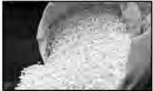
یک متهم را دستگیر کردند که متهم به همراه پرونده برای سیر مراحل قانونی به قرار می‌گیرد و مصرف خودسرانه این دارو عوارض بسیاری به همراه دارد.