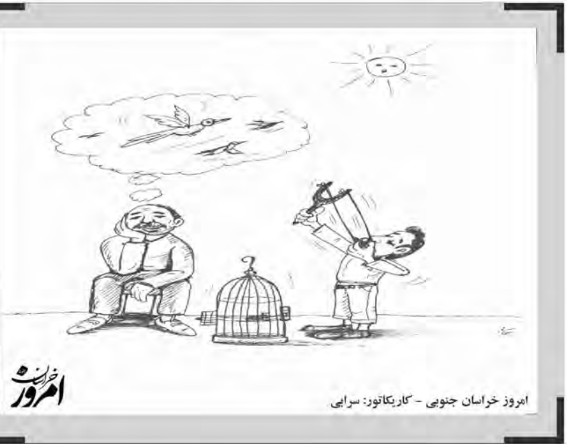
امروز خراسان جنوبی