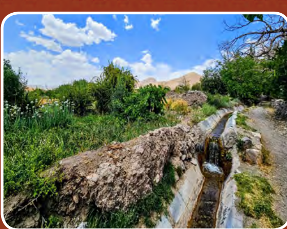
روستای گل خوسف