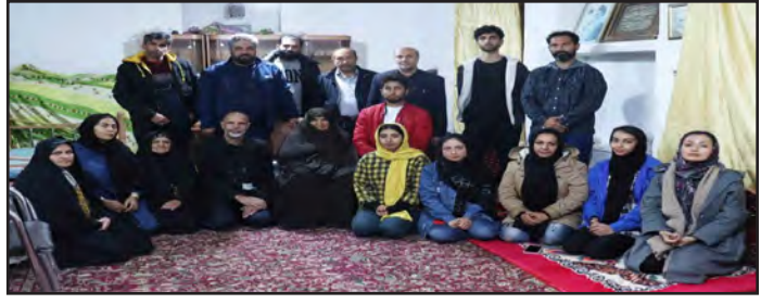
احقاق حق، تعیین سرنوشت، استمرار و پاسداری از خون شهادت، شهادی که با تقدیم جان شان، جانبازان و آزادگانی که با اهدای سلامتی خود و البته مادران، پدران و همسران شهدا که با صبر و تحملی که

کردند؛ باعث شدند نهال انقلاب و جمهوری اسلامی اکنون به درخت ۴۵ساله تنومند و پرثمر تبدیل شده است و از بركات آن نه تنها مردم ایران، بلکه جهان اسلام و جریان مقاومت بهره‌مند شده و استفاده می‌کنند. در این دیدار علاوه بر عوامل سریال تجدیدنظر عارف رئیس شورای کریمو و همچنین نوروزی دهیار روستای کریمو حضور داشتند.