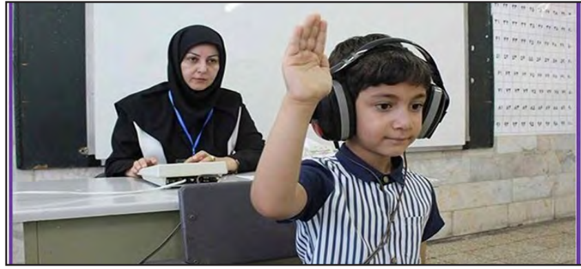
امروز خراسان جنوبی - مهین حیدری

رئیس اداره آموزش و پرورش استثنایی خراسان جنوبی از تمدید مهلت برنامه ملی سنجش و سنجش ۷۵ درصد از کودکان استان خبر داد. محسن ماندگار اعلام کرد: تا دیروز ۱۳۳۰۰ نفر و حدود ۷۵ درصد از کودکانی که در سال تحصیلی ۱۴۰۴-۱۴۰۳ وارد پایه اول ابتدایی می شوند، مورد سنجش آمادگی تحصیلی و سلامت جسمانی بدو ورود به دبستان قرار گرفته اند. وی افزود: این آمار در شهرستان های نهبندان، بشرویه، سرایان، خوسف، دستگردان، سربیشه و فردوس به بالای ۹۰ درصد نیز رسیده است.