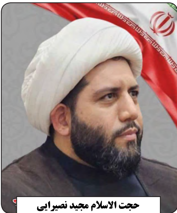
حجت الاسلام مجید نصیری