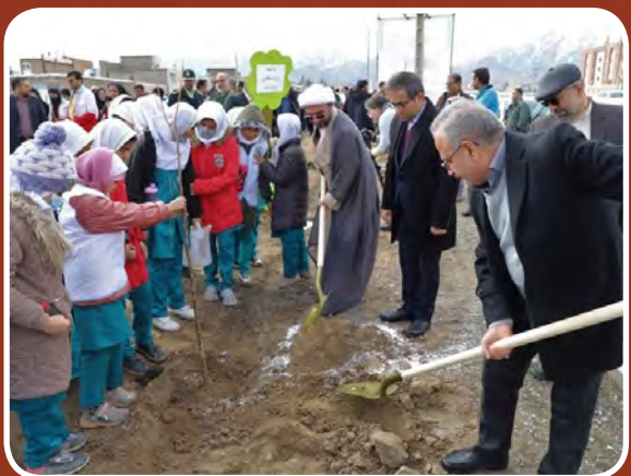
آیین درختکاری در شهرستان بیرجند