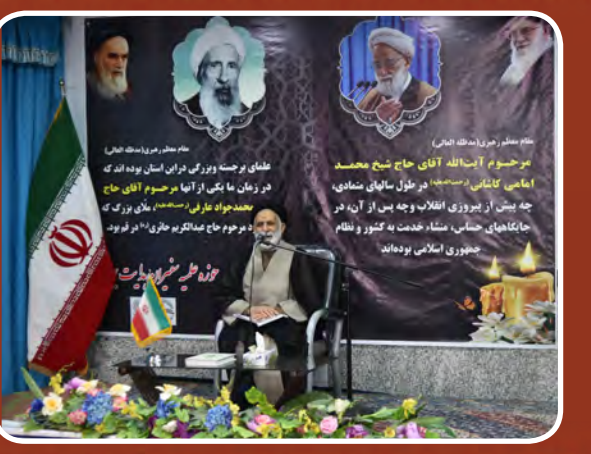
گرامیداشت سالگرد رحلت آیت... عارفی و گرامیداشت رحلت آیت... امامی کاشانی امام جمعه تهران در بیرجند