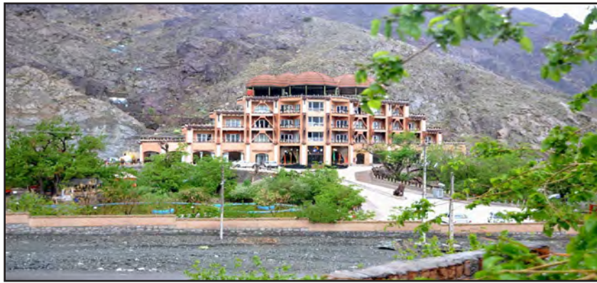
ظرفیت‌های آموزش و پرورش در تمامی شهرستان‌ها در ۴۱ امامزاده، ۱۳ پایگاه اسکان آموزش و پرورش شامل کمیته خدمات اسکان و رفاه ستاد اجرایی خدمات سفر