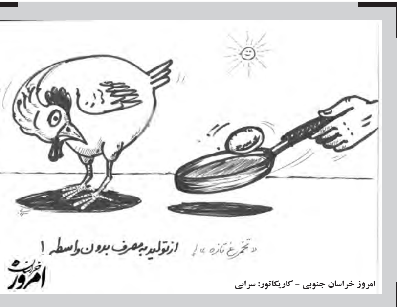
امروز خراسان جنوبی - کاریکاتور: سرایی

مستقیم زیر نظر نهاد کتابخانه‌های عمومی هستند و از کتابخانه‌های نهادی نیز ۲ کتابخانه سیار، ۲۸ مورد روستایی و ۵۴ کتابخانه شهری است. وی با بیان اینکه ۶۰ خدمت در کتابخانه‌های استان به مردم ارائه می‌شود، گفت: جست و جوی کتاب از طریق سامانه‌های تحت وب، سالن‌های مجهز، پیک روز کتاب، بخش‌های مختلف نابینایان و کم بینایان، بخش‌های کودک و نوجوان، بخش مرجع، نسخ خطی، استان‌شناسی و نشریات از جمله این خدمات است. مدیرکل کتابخانه‌های عمومی خراسان جنوبی افزود: برگزاری برنامه‌های ویژه در بخش کودک، مسابقه نقاشی، طراحی چهره کودکان، درختکاری، نشست‌های کتاب‌خوان و کارگاه‌های آموزشی از جمله برنامه‌هایی است که در حاشیه طرح ملی کتابخانه گردی در کتابخانه‌های عمومی استان اجرا شد.