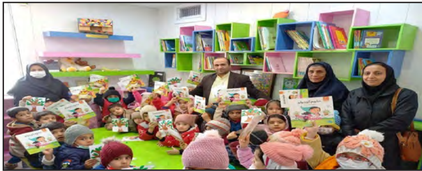
جمعیت رتبه دوم کشور را دارد و در پایان سال با اجرای طرح کتابخانه گردی، تعداد اعضا افزایش خواهد یافت. وی شمار اعضای کتابخانه‌های استان را ۷۰ هزار و ۹۷۰ نفر اعلام کرد و افزود: مدت ضویت در کتابخانه‌ها سالانه

مدیرکل کتابخانه‌های عمومی خراسان جنوبی گفت: طرح کتابخانه گردی به مناسبت بیستمین سالروز تأسیس این نهاد در ۷۲ کتابخانه عمومی استان اجرا شد. به گزارش ایرنا، محمود حاجی افزود: در این طرح ملی که از پانزدهم اسفند اجرا شد، مردم و مسئولان با حضور در کتابخانه‌های مناطق شهری و روستایی از نزدیک با فعالیت‌ها و خدمات متنوع و تخصصی کتابخانه‌ها آشنا می‌شوند. او ادامه داد: در حاشیه بازدید از کتابخانه‌ها و گفت و گو با کتابداران، آن دسته از مسئولان، دانش‌آموزان، دانشجویان و آحاد مردم که علاقه‌مند به کتاب و کتابخوانی هستند به صورت رایگان به عضویت این نهاد فرهنگی در می‌آیند. مدیرکل کتابخانه‌های عمومی خراسان جنوبی با اشاره به اینکه ۱۰ درصد جمعیت استان در کتابخانه‌های عمومی عضو هستند، گفت: در این زمینه خراسان جنوبی بر اساس