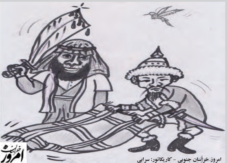
امروز خراسان جنوبی - کاریکاتور: سرایی

تفریحی بر معیشتی، مخصوصاً عدم جمع آوری محصولات آلوده به کرم گلوگاه و هرس نکردن شاخه های خشک یعنی زنگ خطر برای این دنبال داشته است.