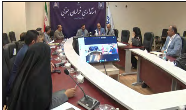
کردند و مقرر شد پیگیری شود. وی گفت: برای یکی از مجموعه هایی که در استان از بانک شهر منابع دریافت کرده بود با

جنوبی بخشودگی جرایم در نظر گرفت. معاون هماهنگی امور اقتصادی استاندار همچنین گفت: یکی از راهکارهای اساسی در کارگروه رفع موانع تولید برای حل مشکلات، تعیین خبرگان بانکی با حکم رئیس کل بانک مرکزی کشور است. اشرفی افزود: در استان ۵ نفر به عنوان خبرگان بانکی استان اعم از فعالین در حوزه بانکی، صنعت و استانداری مشکلات را در کارگروه تسهیل و رفع موانع تولید کارشناسی می کنند و پس از بررسی و ارزیابی به اجرا در بانک عامل مورد نظر رای می دهند و این ظرفیتی است برای سرمایه گذاری که در استان مشکلات و چالش هایی پیش رو دارند.