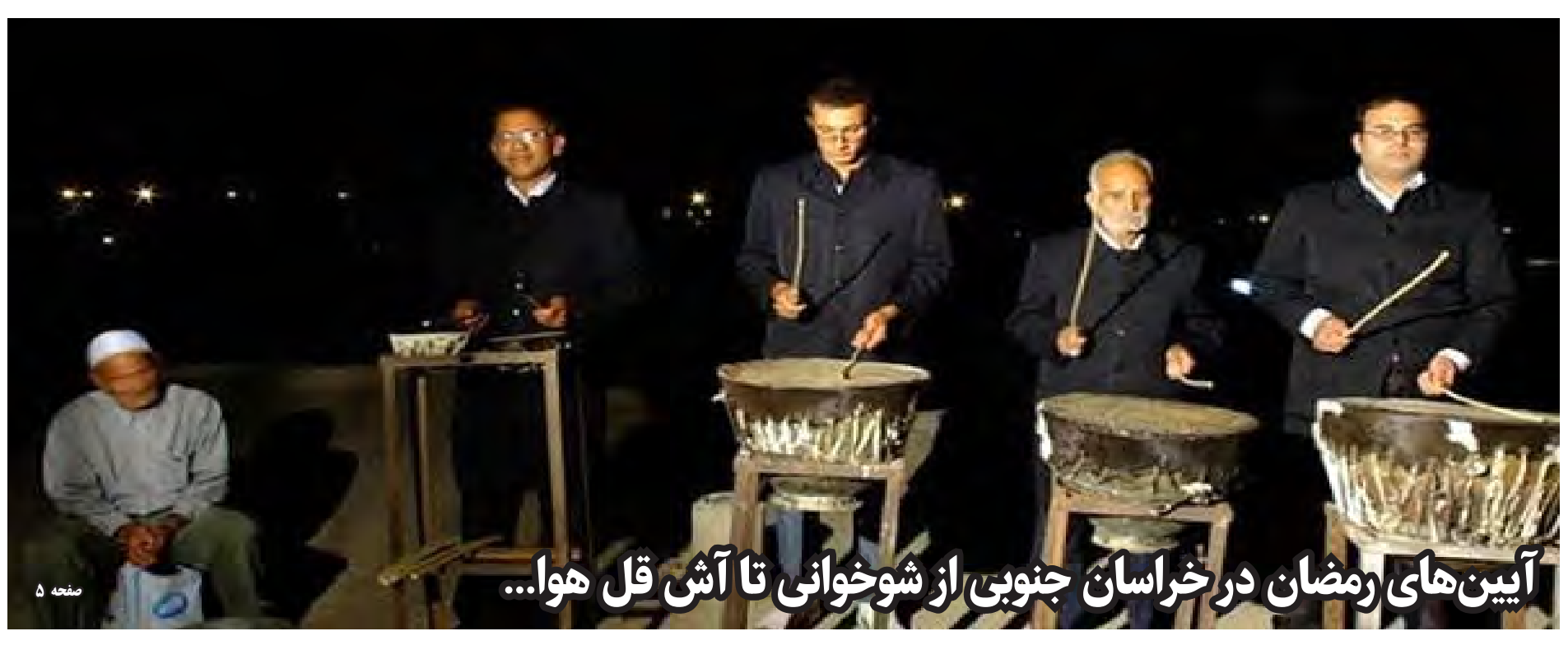
آیین های رمضان در خراسان جنوبی از شوخوانی تا آتش قل هوا...