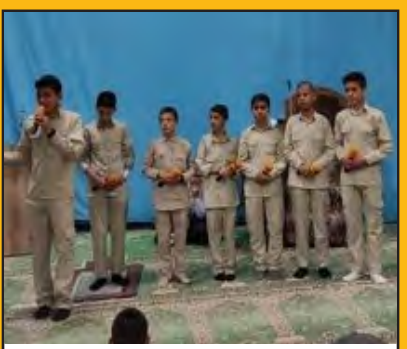
تولید ۱۰ سرود توسط بچه های گروه مصباح

موافقت شورا با گره گشایی اراضی باغ کارگشا