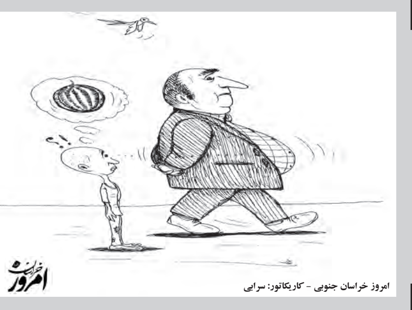
امروز خراسان جنوبی - کاریکاتور: سرایی