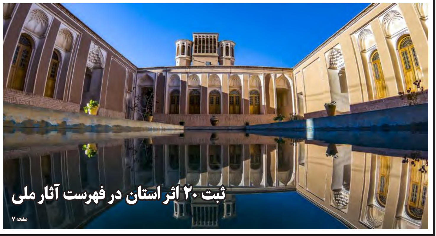
ثبت ۲۰ اثر استان در فهرست آثار ملی