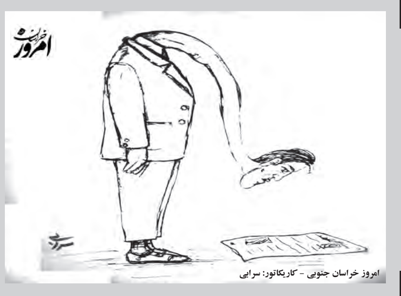
امروز خراسان جنوبی - کاریکاتور: سرایی

۴۴۴ حامی در دومین شب قدر حمایت از ایتم خراسان جنوبی را برعهده گرفتند. معاون توسعه مشارکت‌های مردمی کمیته امداد امام خمینی (ره) استان در گفتگو با خبرنگار صدا و سیما گفت: این تعداد حامی حمایت از ۵۶۴ یتیم و فرزند محسنین (فرزندان دارای پدر از کار افتاده و نیازمند) را برعهده گرفتند. لطفی افزود: در شب نوزدهم نیز ۲۴۹ حامی حمایت از ۳۱۱ یتیم و فرزند محسنین را برعهده گرفتند. وی مجموع حامیان‌کی که در طرح اکرام ایتم از ابتدای ماه مبارک رمضان تاکنون ثبت نام کردند را ۸۹۵ حامی عنوان کرد و گفت: این حامیان حمایت مادی و معنوی از هزار و ۶۲۵ یتیم و فرزند را بر عهده گرفتند. معاون توسعه مشارکت‌های مردمی کمیته امداد امام خمینی (ره) استان از برپایی ۵۵ پایگاه حامی یابی به مناسبت شب‌های قدر در استان خبر داد و گفت: این پایگاه‌ها در اماکن مذهبی، مساجد و مکان‌های برگزاری مراسم شب قدر برپا شده است. لطفی افزود: حامیان و خیران می‌توانند علاوه بر حضور در پایگاه‌های حامی یابی در استان از طریق سایت اکرام به نشانی ekram.emdad.ir و همچنین ارسال عدد ۱ به سامانه پیامکی ۳۰۰۳۳۳۳۳ نسبت به ثبت نام در طرح اکرام ایتم و محسنین اقدام کنند. هم اکنون دو هزار و ۴۶۹ یتیم و هشت هزار و یک نفر فرزند محسنین زیر پوشش کمیته امداد امام خمینی (ره) خراسان جنوبی هستند.