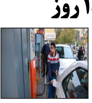
نیز خبر داد و افزود: با مصرف این مقدار گاز سی ان جی، همین حجم در مصرف بنزین صرفه جویی شده است. وی عنوان کرد: ۱۰ جایگاه عرضه سوخت مایع و ۲۵ جایگاه سی ان جی در خراسان جنوبی وجود دارد و تلاش همکاران منطقه سوخت‌رسانی مستمر به مردم استان و مسافران است.