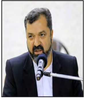
از جمله مواردی بود که در این نشست پیشنهاد داده شد. بازدید رایگان از موزه‌ها و اعمال تخفیف برای استفاده و بازدید از امکان گردشگری ویژه هنرمندان انقلابی، برگزاری مسابقات کتابخوانی با محوریت شهید آوینی، معرفی کتاب برتر هنر انقلاب، شناسایی مولفان و هنرمندان انقلابی کارگر، حمایت از آثار تولیدی هنرمندان و برگزاری کارگاه‌های آشنایی با هنر انقلاب از دیگر پیشنهادات بود.

مختلف انقلاب آثار و هنرمندان فاخری داریم که در رأس آن شهید، جانبازان و ایثارگران قرار دارند، کسانی که با نثار جان خود بالاترین افتخارات را برای کشور به ارمغان آورده‌اند که هر چقدر به این موضوع پرداخته شود، کم است. وی بر ضرورت تبیین ابعاد مختلف شخصیتی و نظری شهید آوینی تأکید کرد و گفت: نسل جوان به ویژه دانشجویان باید با آثار برتر هنر انقلاب آشنا شوند. طالبی افزود: با برپایی نمایشگاه‌ها، آکران فیلم، اجرای نمایش، نصب پوستر، اجرای تئاتر، شعرخوانی، داستان‌خوانی و سایر فعالیت‌ها در این هفته می‌توان این ظرفیت را برای قشر دانشجویان فراهم کرد. همچنین استفاده از ظرفیت و توان اساتید دانشگاهی و دانشجویان، برگزاری نشست‌های نظری پیرامون هنر انقلاب در حوزه هنری استان قرار دارد و هر سال مقارن با این هفته برنامه‌های مختلفی در استان پیش‌بینی و اجرا می‌شود. طالبی گفت: در حوزه‌های