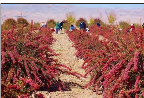
امروز خراسان جنوبی- صالحی پارسال ۷۱ میلیارد و ۵۱۰ میلیون تومان تسهیلات بخش جهش تولید در خراسان جنوبی پرداخت شد. علاوه بر این رقم، تسهیلاتی قابل توجه در دیگر بخش

افزود: این تسهیلات در زمینه‌های ساخت و راه اندازی و تأمین سرمایه بهره برداران در بخش سردخانه، گلخانه و طرح‌های صنایع تبدیلی و غذایی پرداخت شده است. به گفته وی در راستای توانمندسازی تشکل‌های بخش کشاورزی به عنوان بازو اجرایی سازمان جهاد کشاورزی به بانک عامل معرفی می‌شوند و برای خرید توافقی محصولات کشاورزی و تأمین نهاده‌های تولید، بذر، کود و سم در اختیار بهره برداران قرار می‌گیرد. مدیر امور سرمایه‌گذاری جهاد کشاورزی استان گفت: تسهیلات سرمایه در گردش با نرخ سود ۱۸ درصد و بازپرداخت یک ساله پرداخت شده است. مدیر امور سرمایه‌گذاری جهاد کشاورزی استان گفت: تسهیلات سرمایه‌گذاری جهاد کشاورزی استان اسفند پارسال هم گفت: ۵۸۵ میلیارد و ۸۰۰ میلیون تومان در بخش‌های مختلف کشاورزی خراسان جنوبی پرداخت شد.