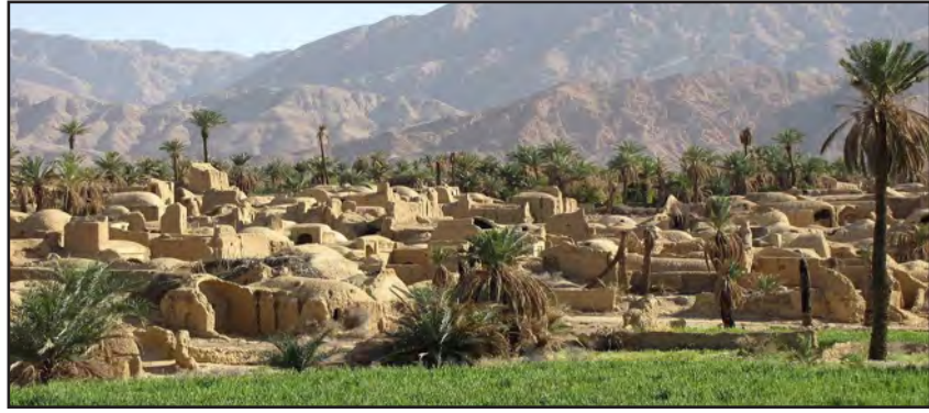
امروز خراسان جنوبی- شهرستان ها

پیپیپروسنتای زیبای اصفهک در لیست انتخابی سازمان جهانی گردشگری به عنوان بهترین دهکده گردشگری