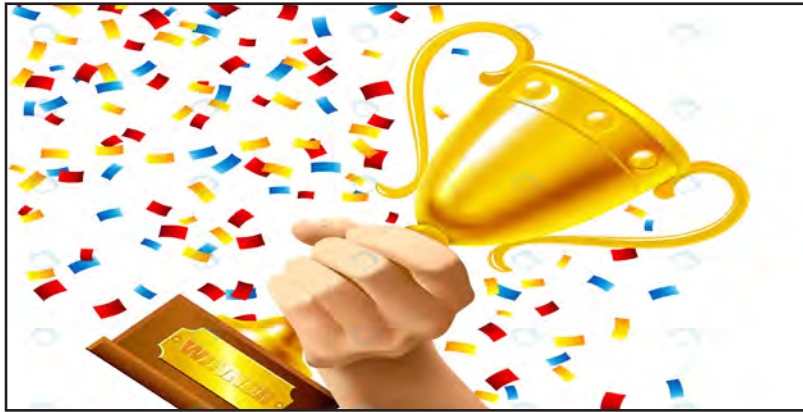
های گذشته موضوعی قابل بحث است.