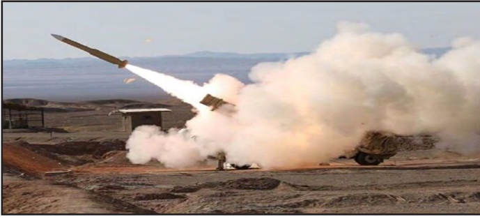
منطقی را انجام داد.

و از طرفی ممنوعات بین المللی از جمله کشتن کودکان، زنان و هدف گرفتن بیمارستانها را هم زیر پا گذاشتند اما جمهوری اسلامی ایران فقط پایگاه هوایی اسرائیل و جایی که از آنجا به کنسولگری ایران در دمشق حمله شده بود را هدف گرفت، جایی که هیچ جمعیتی نبود. وی گفت: الگوی ما امیر مؤمنان است ایشان می فرماید جواب دشمن را بدهید حتی از آن تعبیر می شود حرکت تهاجمی داشته باشید نه انتفالی، حتی در خطبه ۲۷ نهج البلاغه آمده است با دشمن قبل از اینکه با شما بجنگد، بجنگید و کسانی که منتظر شدند دشمن تا دالان خانه بیاید و بعد دفاع کنند اینها دلیل هستند ایران به دلیل اینکه بهانه ای دست برخی از دولت ها نیفتد پیش دستی نکرد اما در دفاع از خودش کار