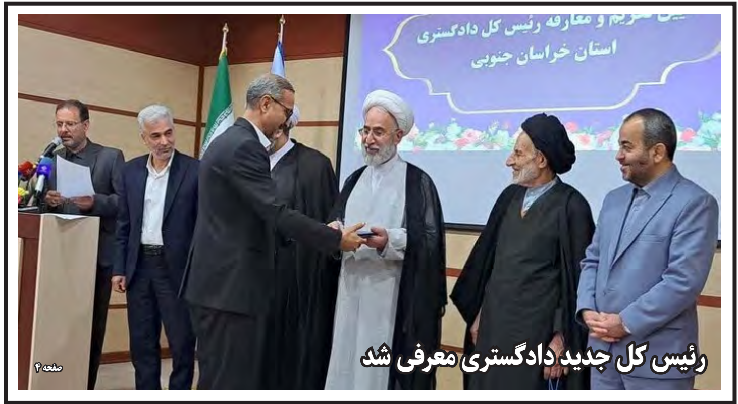
رئیس کل جدید دادگستری معرفی شد