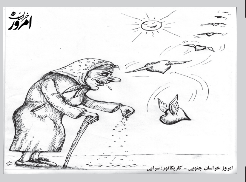
امروز خراسان جنوبی