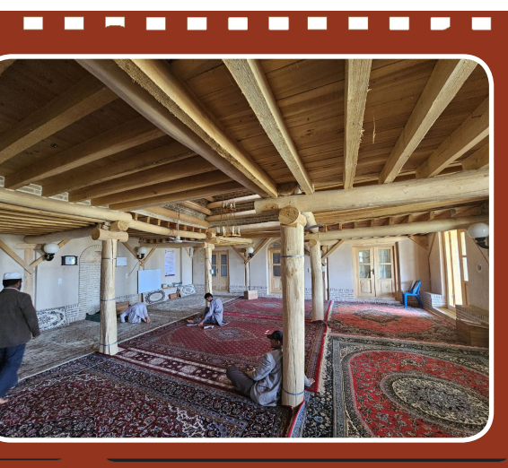
روستا و قلعه فورگ در میان