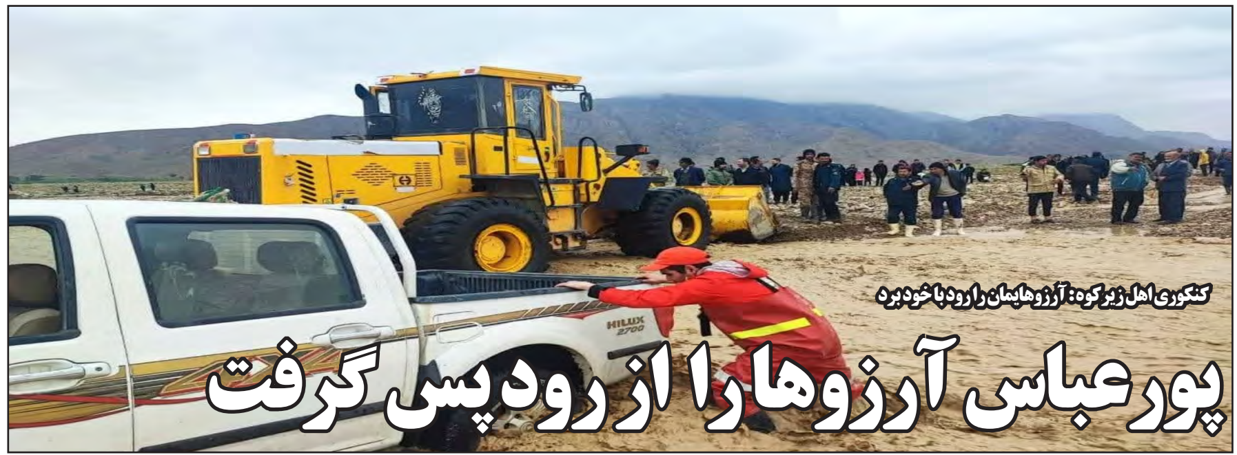
کنکوری اهل زیرکوه: آرزوهایمان را رود با خود بره