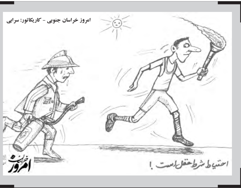
امروز خراسان جنوبی - کاریکاتور: سربابی