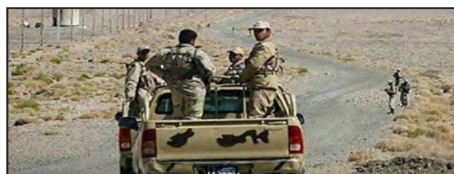
نوابر اعلام مرزبانی کشور، تعداد ۶ نفر از کارکنان گروهان احتیاط مرزی استان خراسان جنوبی که برای رصد و پایش

امروز خراسان جنوبی - گروه حوادث ۶ مرزبان بازداشت شده در شرق کشور در پی انجام اقدامات لازم از سوی جمهوری اسلامی ایران آزاد شدند. در پی اقدامات لازم از سوی ایران ۶ نیروی مرزبان که در جنوب شرق کشور توسط نیروهای طالبان بازداشت شده بودند، آزاد شدند. عصر پنجشنبه نیروهای طالبان، ۶ مرزبان ایرانی را به پهانه ورود غیرقانونی به خاک افغانستان بازداشت کردند.