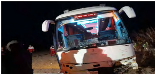
کروند یک دستگاه اتوبوس با یک وانت تویوتا حامل سوخت قاچاق برخورد کرده است که بر اثر این حادثه رانندگی خودرو تویوتا حامل سوخت، دچار حریق شده و خراسان جنوبی است.