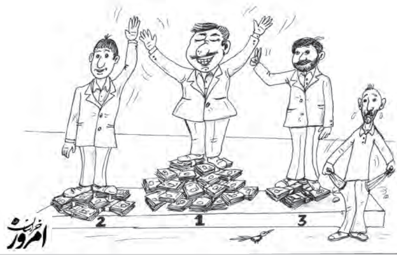
امروز خراسان جنوبی - کاریکاتور: سرایی

استاد گروه چشم‌پزشکی دانشگاه علوم پزشکی بیرجند گفت: لیزیک و یا PRK به معنی لیزر در ضخامت قرنیه بوده و این عمل در افرادی که نزدیک بینی، دوربینی و آستیگماتیسم دارند، موثر بوده و باعث کاهش وابستگی فرد به عینک و لنز تماسی می‌شود. داوری با اشاره به اینکه توسعه ارائه خدمات تخصصی چشم پزشکی، مورد نیاز استان است اعلام کرد و گفت: یکی از پیشرفته‌ترین دستگاه‌های حذف عینک و رفع عیوب انکساری چشم راه اندازی می‌شود.