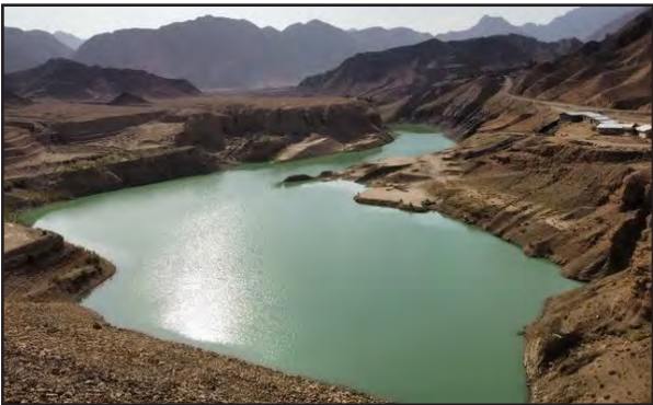
مکعب آب در این سازهها جمع شده است.

وی همچنین میزان بارشها در بلند مدت را در استان ۱۳۳ میلی متر عنوان کرد که امسال یک درصد افزایش داشته است.