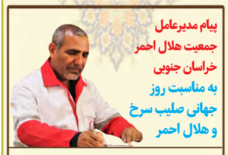
پیام مدیرعامل جمعیت هلال احمر خراسان جنوبی به مناسبت روز جهانی صلیب سرخ و هلال احمر

مدیرعامل جمعیت هلال احمر خراسان جنوبی به مناسبت روز جهانی صلیب سرخ و هلال احمر پیامی صادر کرد. متن پیام به شرح زیر است: اردیبهشت ماه هر سال نتهتها در تقویم ایران که در سراسر جهان یادآور تلاش زنان و مردانی است که خدمت به همنوع و تلاش برای پیشگیری و تسکین دردها و مصائب نوع بشر را همچون فریضه ای انسانی و الهی چیراغ راه زندگی خود قرار داده اند. آن ها که در لباس سرخ رنگ خود بی هیچ ادعا و مطالبه ای برای زدودن غبار غم و اندوه و محرومیت از چهره جهان پر از حادثه و مصیبت امروز، بهترین و شیرین ترین روزهای زندگی خود را خالصانه وقف کرده اند. به یقین دست هایی که برای کاستن از آلام بشری، تلاش را جایگزین حرف و شعار می کنند و از سرمای زمستان و دافی تابستان بیمی به دل راه نمی دهند، مقدس ترین و زیباترین تندیس های نودوستی هستند که در قالب امدادگران جمعیت هلال احمر نیز شناخته می شوند. سال ها و دهه ها مجاهدت فرزندان ایران اسلامی در لباس امدادگری و داوطلبی، امروز به بار نشسته و جمعیت هلال احمر ایران به عنوان یکی از باتجربه ترین و برترین جمعیت های ملی در سراسر دنیا، با کارنامه ای درخشان، مایه فخر همه ایرانیان از بزرگ و کوچک گرفته تا پیر و جوان شده است. جایگاهی که بی شک جز با همت، رشادت، همدلی و هم زبانی همه اعضای این خانواده بزرگ محقق نمی شد. اینجانب روز جهانی صلیب سرخ و هلال احمر را گرمی داشته و ضمن تقدیر از تلاش های شبانه روزی اعضای جمعیت هلال احمر استان، برای تک تک تلاشگران این عرصه خطیر، توفیق روزافزون آرزو مندم.