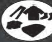
البسه و پتو