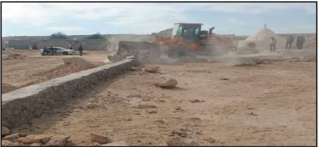
به نفع اشخاص صادر می شود.

۲۱۳ هکتار زمین استان از دست متصرفان خارج شد