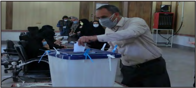
سامانه اینترنتی داوطلب به آدرس (davtabelab.shora-gc.ir) مراجعه و نمایندگان خود را معرفی می کنند.