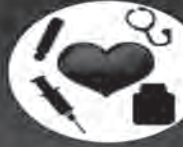
دارو و لوازم بهداشتی