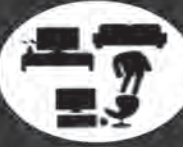
لوازم خانگی و اداری