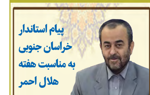
پیام استاندار خراسان جنوبی به مناسبت هفته «هلال احمر» پیامی صادر کرد. متن پیام به شرح زیر است: به نام خدا