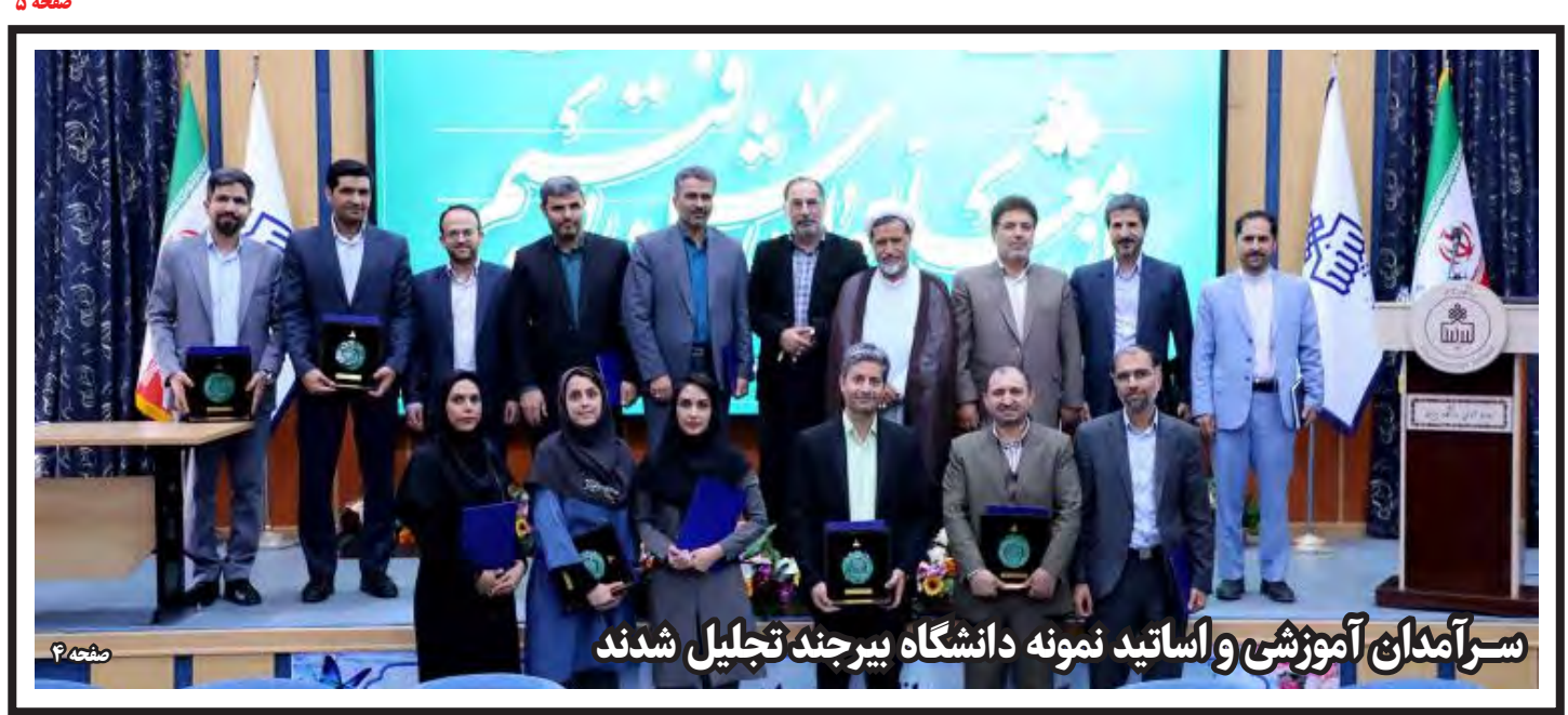
سرآمدان آموزشی و اساتید نمونه دانشگاه بیرجند تجلیل شدند