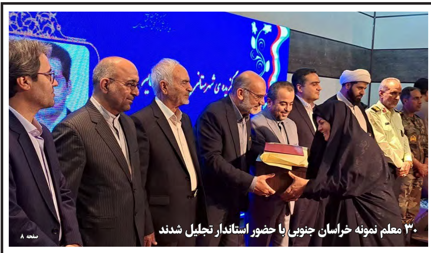
۳۰ معلم نمونه خراسان جنوبی با حضور استاندار تجلیل شدند