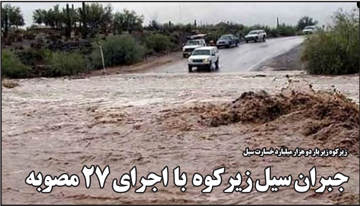
زیرکوه زیر بار دو هزار میلیارد خسارت سیل