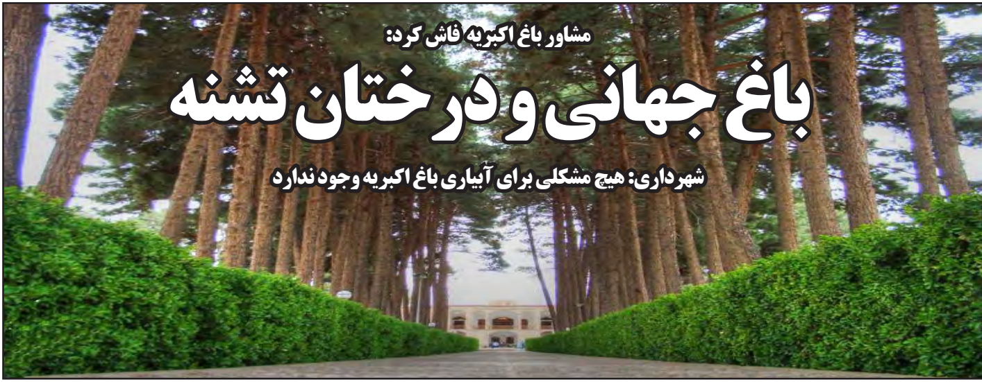
مشاور باغ اکبریه فاش کرد: