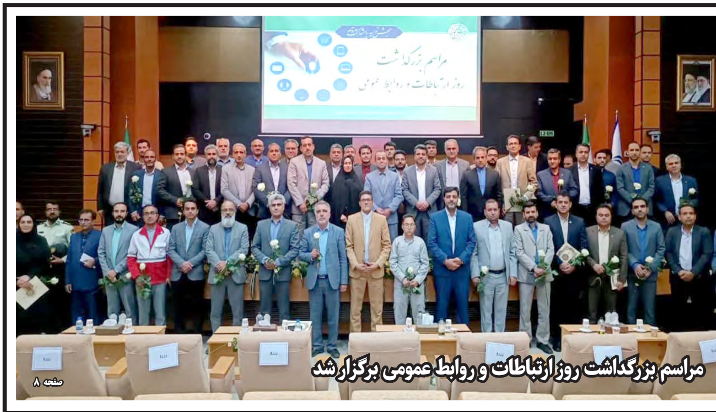
مراسم بزرگداشت روز ارتباطات و روابط عمومی برگزار شد

متخلفان ۱۵ روز فرصت دارند اصناف و ادارات پارسی را پاس بدارند