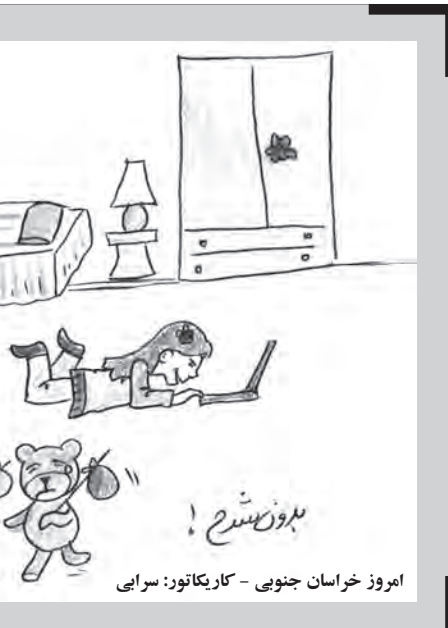
امروز خراسان جنوبی - کاریکاتور: سرایی

۵۸ دانش آموز که در چهارمین جشنواره علمی و پژوهشی پژوهش‌سراهای دانش‌آموزی کشور، رتبه‌های نخست تا سوم استانی و منتخب کشوری را کسب کردند، با حضور جمعی از مسئولان در بیرجند تجلیل شدند. معاون آموزش متوسطه اداره کل آموزش و پرورش خراسان جنوبی در مراسم تجلیل از دانش‌آموزان برتر استانی و منتخبان کشوری این مسابقات گفت: خراسان جنوبی دارای پیشینه طولانی در علم و پژوهش است به طوری که از ۱۲ پدر علم شناخته شده در کشور، زادگاه هفت نفرشان در بیرجند و این استان است که مسئولیت ما را در زمینه سازی علمی و شکوفایی استعدادهای دانش آموزان سنگین‌تر