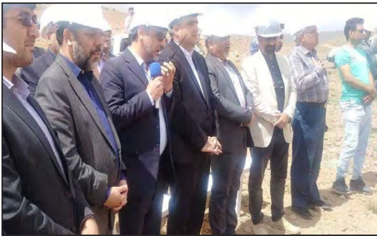
خواهد شد. وی عنوان کرد: عملیات زیرسازی طرح راه آهن خراسان جنوبی ۳۶ ماهه است که امیدواریم کل خط را در برنامه زمان‌بندی ریل راه آهن در سال ۱۴۰۴ وارد استان شود.

زیرسازی مسیر ریلی بیرجند - قاین - یونسی آغاز شد