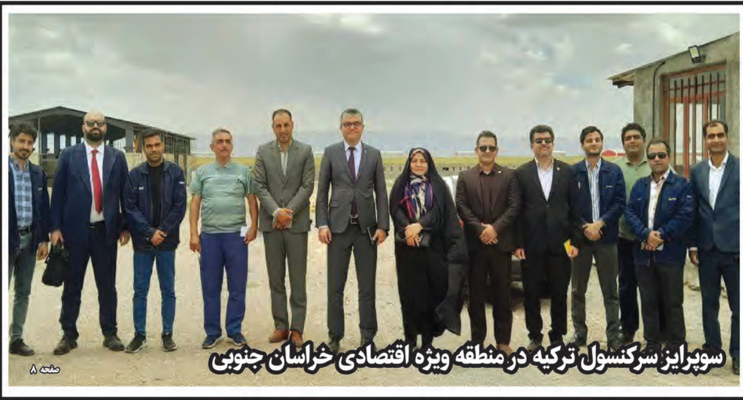
سوپرایز سرکسول ترکیه در منطقه ویژه اقتصادی خراسان جنوبی