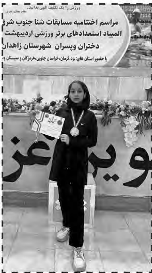
ورزش را یک تکلف الهی بدانند. مقام معظم رهبری مراسم اختتامیه مسابقات شنا جنوب شرق المیاد استعدادهای برتر ورزشی اردیبهشت دختران و پسران شهرستان زاهدان با حضور استان های: یزد، کرمان، خراسان جنوبی، هرمزگان و سیستان و