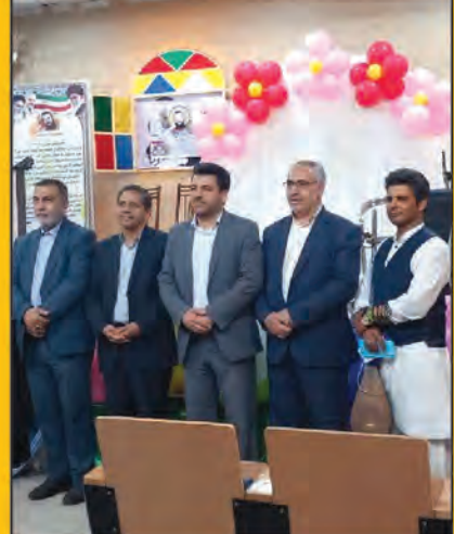
کاروانی از جنس کرامت که ره عشق را می پیماید این هنر به عشق دخیل می بندد