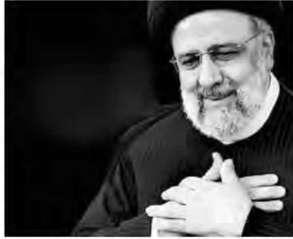
امروز خراسان جنوبی - صالحی شورای هماهنگی تبلیغات اسلامی خراسان جنوبی در اطلاعیه ای از مردم این استان برای حضور در مراسم وداع و تشییع پیکر شهید آیت... سید ابراهیم رئیسی در بیرجند دعوت کرد. در این اطلاعیه که دیروز منتشر شد آمده است: هر چند عروج خادم الرضا

مرگ هایی چنین میانه میدان "آزوی مردان" است که در ایران ما ۲۴۰ هزار امضا پای سندان ثبت شده است. شهادت اما ظهور دیگری هم دارد؛ در میدان خدمت. جایی که مردان مردانگی را در شکوه آستین بالا زدن برای خدمت به خلق معنا می کنند. کاری چنین خود چنان آدمی ا شهید در کام می کند که شهود هم در جان بنشیند. کار می کند و گره می گشاید. به وقت مقدر هم تحریر خدایی «ارجعی الی ربک» در صحیفه تقدیر او رقم می خورد. چنان که پیشتر ها در حق خادمان ملت رقم خورد و چنان که شکوه تازه آن را در حادثه حدیث شده "شهید جمهور" رئیس و همراهان دیدیم. او که با رای ۱۸ میلیون نفری رئیس جمهور شد، با خدمت به ۸۵ میلیون نفر به شایستگی مقام رفیع "شهید جمهور" رسید. جمهور هم قدر شهید خود را نیکو می داند چنان که در تبریز و قم و تهران، به حضور میلیونی خود گواهی داد. چنان که بیرجند و مشهد هم پای این سندان به حضور امضا خواهد گذاشت. آنچه مهم است و باید با اهمیت حراست شود همین همگامی و جمهوری است که حول شهادت "شهید جمهور" رقم خورده است. افراد از جریان های مختلف، با وجود همه تفاوت نگرشی و ملی، کنار هم قرار گرفته اند. همین هم افزایی ظرفیت هاست که قوت می دهد به انسجام ملی و همین هم تیشه می شود برای تراشیدن پایه های خیال خام دشمنان. و همین هم به شدت آنان را عصبانی کرده است. فضای مجازی و رسانه ای گواه است بر این خشم شان. همه پای وطن می مانیم. این راه شهداست. هر که در این راه قدم بردارد ادامه دهنده راه شهید خواهد بود. اصحاب تفرقه در میدان دشمن بازی می کنند. هر ادعایی هم که داشته باشند فرق نمی کند.