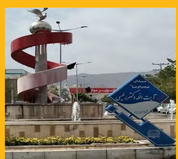
نامگذاری ۲ مکان بیرجند به نام شهید رئیسی

• خروش عاشورایی نتیجه فداشدن برای تعالی کشور ۵۲/ نسخه سمی ۴/ محکومیت میلیاردی قاچاقچی سوخت در سربان ۴/ خانه فرهنگ بیرجند به نام سید الشهدای خدمت نامگذاری شد ۴/ تواضع و اخلاص به آیت... رئیسی مقام رفیع داد ۲/ مهمترین هنر شهید جمهور ایجاد وحدت بین آحاد ملت بود ۵/ بدرقه کاروان حج تمتع به سرزمین وحی ۲/