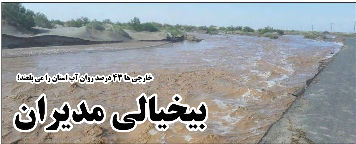
خارجی ها ۴۳ درصد روان آب استان را می بلعند!

کشور اینک درمراحل سختی قرار دارد، مردم انواع شعارها و اعمال و اصالت ها و فصاحت ها و رسالت ها و کیاست ها را دیده اند اینک در به در به دنبال تیمی قوی و متعالی و عقل محور و ضدشعار و متخصص میگرددند ، تیمی که ۸۵ میلیون ایرانی را ببیند نه تعداد معدود و محدودی را.