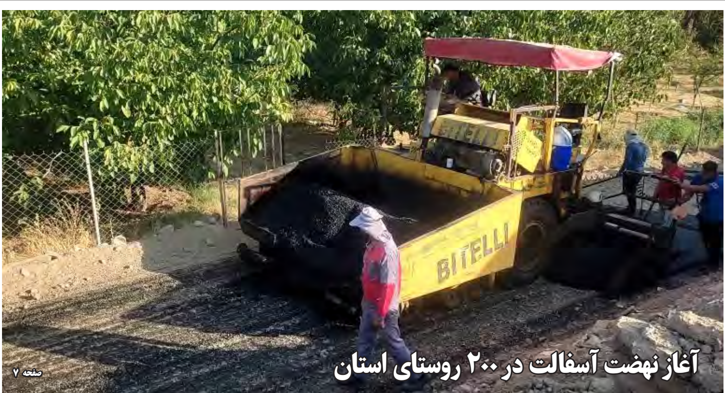
آغاز نهضت آسفالت در ۲۰۰ روستای استان