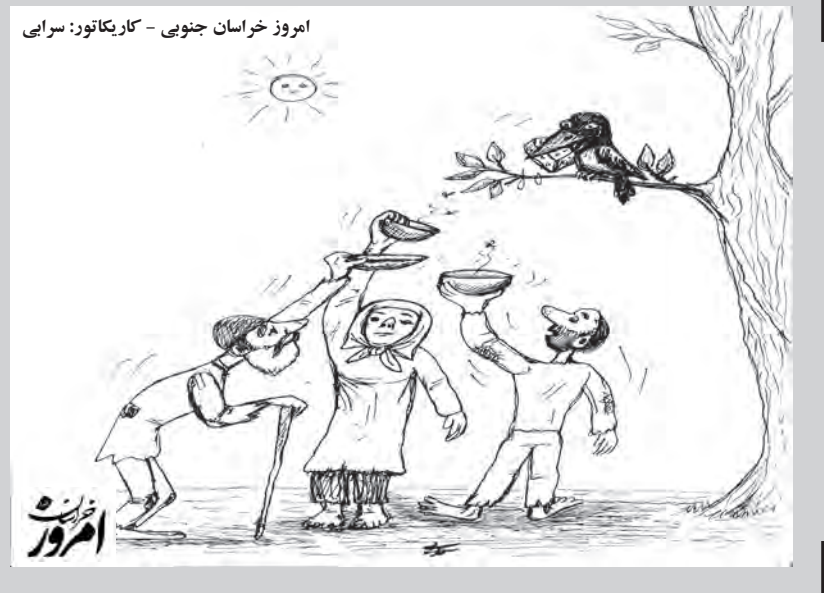
امروز خراسان جنوبی - کاریکاتور: سزایی