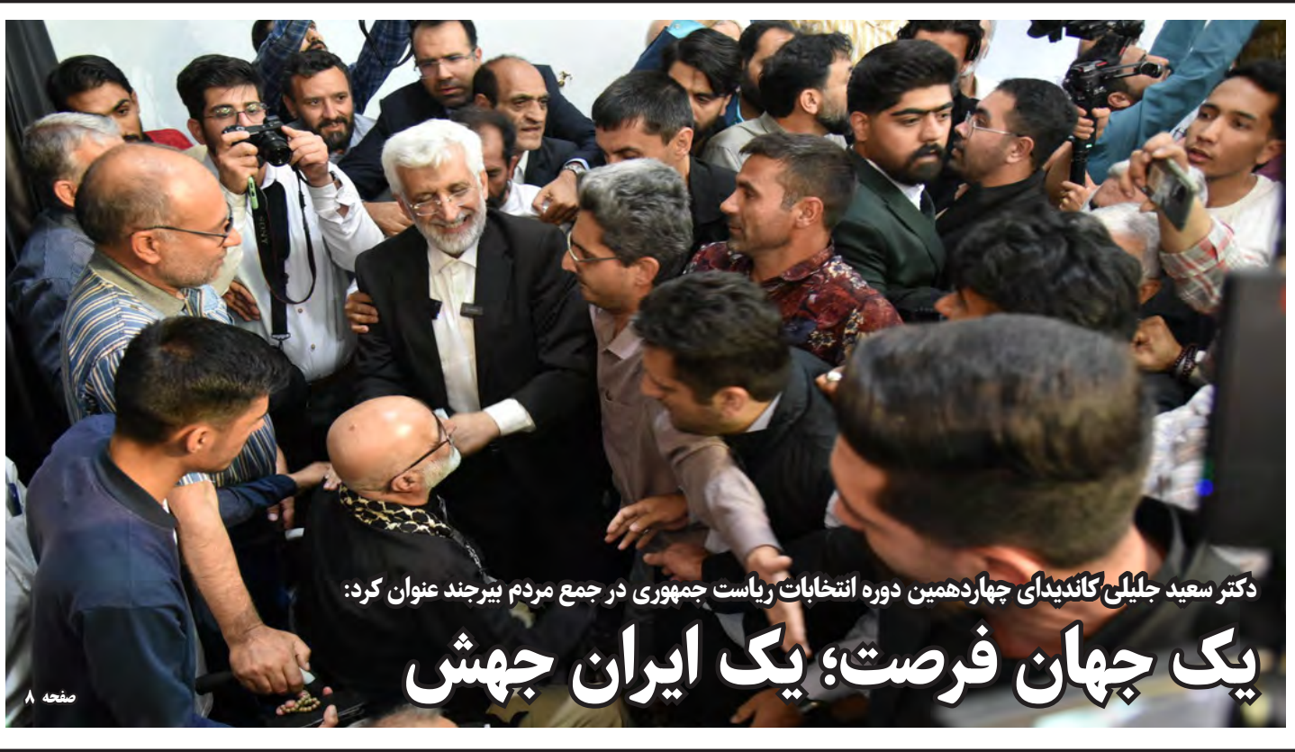
دکتر سعید جلیلی کاندیدای چهاردهمین دوره انتخابات ریاست جمهوری در جمع مردم بیرجند عنوان کرد: