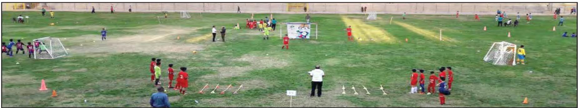
امروز خراسان جنوبی