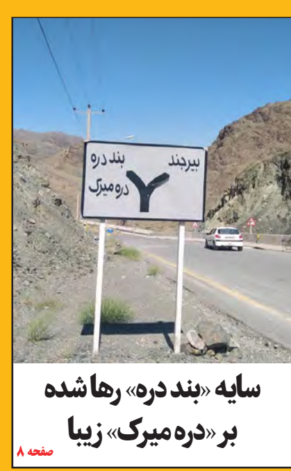
سایه «بندر دره» رها شده بر «دره میرک» زیبا