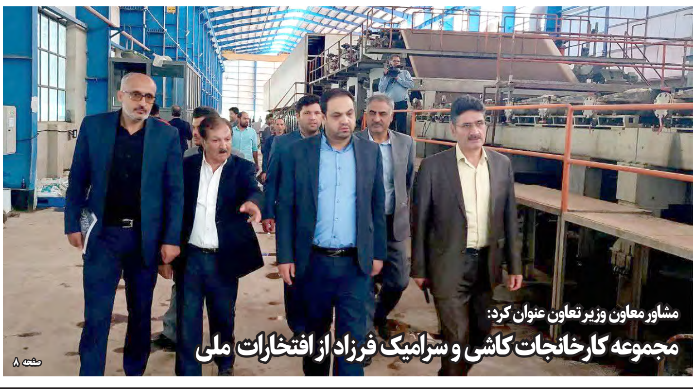
مشاور معاون وزیر تعاون عنوان کرد: مجموعه کارخانجات کاشی و سرامیک فرزاد از افتخارات ملی

وزیر میراث فرهنگی، گردشگری و صنایع دستی گفت: من در موضوع افزایش تعطیلات آخر هفته طرفدار مصوبه مجلس یازدهم هستیم و معتقدم می تواند به رونق گردشگری کمک کند. عزت... ضرغامی در گفت و گو با اینلنا، درباره عدم تعیین تکلیف مصوبه تعطیلی آخر هفته گفت: مجلس قبل تصویب کرد که ما ۲ روز تعطیلی داشته باشیم، حتما ۲ روز تعطیلی بسیار به حوزه گردشگری کمک می کند. وزیر میراث فرهنگی، گردشگری و صنایع دستی خاطرنشان کرد: ما طرفدار مصوبه هستیم، قاعدتا یک بحث هایی هم بین پنجشنبه و شنبه است، ما نظرات خودمان را قبلا اعلام کردیم، البته دولت برای خودش یک موضعی دارد و ما هم نظرات خودمان را اعلام کردیم. وی ادامه داد: من امروز طرفدار مصوبه مجلس یازدهم هستیم و معتقدم می تواند به رونق گردشگری کمک کند.