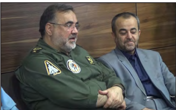
امیر سرتیپ واحدی در سفر به خراسان جنوبی پس از بازدید از فرودگاه بیرجند از راه اندازی پرواز هوایی شرکت ساها

امروز خراسان جنوبی- رجب زاده- مردم بیرجند از کمبود پروازها و ضعف خدمات پروازی در مرکز استان رنج می برند و گاهی یک مسافرت هوایی به پایتخت آن ها در لیست انتظار چند هفته ای معطل می کند. با تعدد شرکت های هواپیمایی از بار سنگین این مشکل که فشار آن بردوش مردم است کم می شود؛ حالا قولی تازه، تکاپویی دوباره به آسمان استان بخشیده است. ساها بر فراز استان بال خواهد گشود. فرمانده نیروی هوایی ارتش جمهوری اسلامی ایران از راه اندازی و ارائه خدمات یک فروند هواپیمای مسافربری از شرکت ساها مربوط به نیروی هوایی ارتش به فرودگاه بیرجند خبر داد.