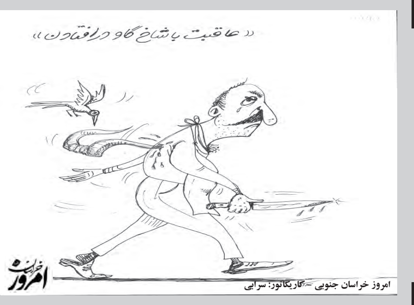
امروز خراسان جنوبی - نگار یگانوز: سزایی

تغییر رنگ به سمت قهوه‌ای یا خاکستری نشان دهنده فساد است