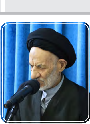
آیت‌الله العظمی آیت‌الله محمد باقر محمدتقی‌نژاد، نماینده ولی فقیه در استان خراسان جنوبی، در دیدار با معاون فرهنگی سازمان تبلیغات اسلامی خراسان جنوبی، آیت‌الله محمد باقر محمدتقی‌نژاد، در مشهد.

این کار متأسفانه صورت نگرفته است و برخی از این افراد معاند نیستند و باید قدم‌های